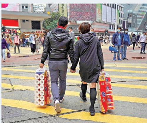
生活必需品成為疫潮下唯一遭搶購物資，主攻民生消費的生意成逆市奇葩。資料圖片

事實上，今次的舖位劈價潮預計將會掀起一股舖位換貨潮，由旅遊區轉民生區，或由核心區民生舖轉非核心區民生舖，民生舖位將會成為這次浪潮後的其中一個主要投資方向。