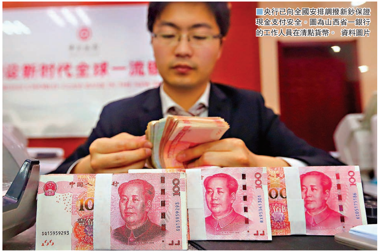
央行已向全國安排調撥新鈔保證現金支付安全。圖為山西省一銀行的工作人員在清點貨幣。資料圖片

疫情是否會影響註冊制等資本市場改革的節奏和速度？閻慶民對此表示，疫情影響是短期的，證監會堅定推進改革開放的方向和決心不會改變。當前證監會抓好疫情防控的同時，繼續推進科创板制度創新，鼓勵更多硬科技企業上市，同時推進創業板改革並試點註冊制。同時，繼續保持股票首發的常態化，推動提高上市公司質量，積極拓展中長期資金來源，鼓勵和支持社保、保險、養老金等中長期資金入市等。另外，支持疫情嚴重地區相關企業發行公司債券、資產支持證券。