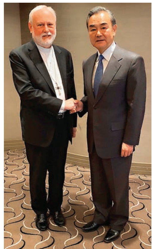
國務委員兼外長王毅（右）在德國慕尼黑與梵蒂岡外長加拉格爾會見。

香港文匯報訊 據新華社報道，當地時間14日，國務委員兼外長王毅在慕尼黑與梵蒂岡外長加拉格爾會見。