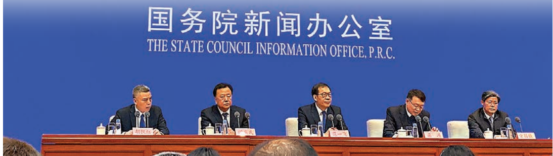
國新辦發佈會現場。