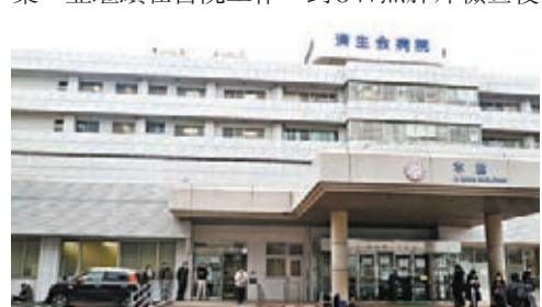
有田醫院被懷疑出現醫院感染。

和歌山縣湯淺町的濟生會田醫院一名50餘歲男性外科醫生在前日確診，是日本首名感染新冠肺炎的醫生。他近期沒有外遊記錄、沒有接觸中國訪客，在上月31日出現發燒、全身乏力等病徵，本月3至5日期間服用退燒藥，並繼續在醫院工作，到8日照肺片檢查後發現有肺炎徵狀，前日確證對新型冠狀病毒呈陽性反應。