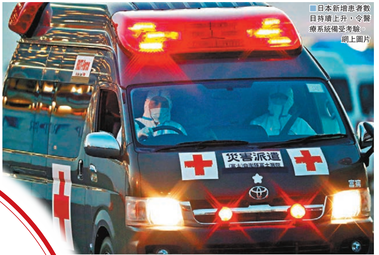
日本新增患者數目持續上升，令醫療系統備受考驗。