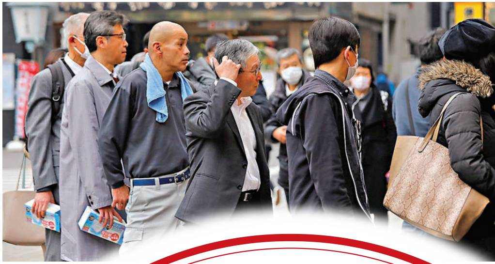
東京居民排隊搶購口罩。