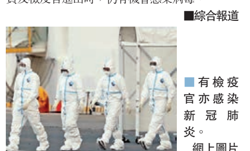
有檢疫官亦感染新冠肺炎。

厚生勞動省前檢疫官木村盛世認為，確證檢疫官與感染者應沒有密切接觸，估計新型冠狀病毒傳染力非常強，而檢疫所有不同人進出，難以排除疫情透過檢疫官再擴散。一名曾接受大型船舶檢疫工作訓練的檢疫所前所長則指出，即使乘客只留在房內，負責日常工作的船員及檢疫官進出時，仍有機會感染病毒。