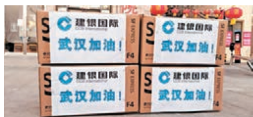
建銀國際第一時間組織物資，送往武漢等疫區一線。

香港文匯報訊 建銀國際發揮金融機構專業所長，積極保障企業融資，對部分因疫情影響延期支付的香港上市公司，迅速推出免收罰息等紓因