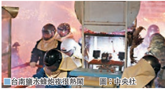
■台南鹽水蜂炮夜很熱鬧