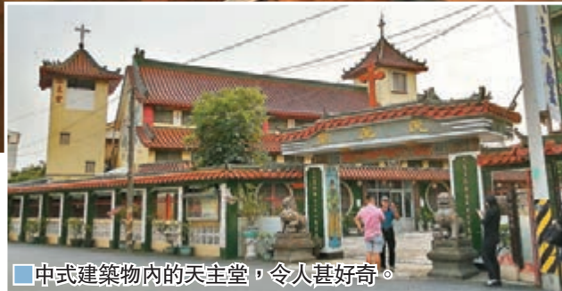
■中式建築物內的天主堂，令人甚好奇。