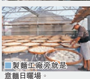
■製麵工廠旁就是意麵日曬場。