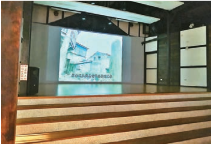
■開放供旅客參觀時，永成戲院會放映紀錄片給你看。

永成戲院看上去更像是一個日本小鎮上的大宅，矮矮的三角屋頂下一幢樸實又極富古雅色彩的房子齊地建成，日式氣息撲面而來，原來它在歷史長河中歷經波折，爾後經由政府修葺才重新整改成為目前的模樣，變成了一個歷史氣息濃重的藝文中心，以供參觀及使用。戲院裡保留了永成戲院舊日營業時播放的布簾、檯木長座椅及老電影放映機，戲院裡還有與拍電影相關的器具、古老的影片膠帶及當時有名的影歌星所簽名留下的足跡。