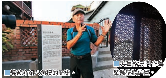
■導遊介紹八角樓的歷史。

八角樓親歷了日據時期，曾被日本親王伏見宮貞愛在侵台時作為下榻之地。後來，八角樓以「伏見宮貞愛親王御遺跡」的名義指定為史蹟，於2003年公告為歷史建築，2009年公告為古蹟，供遊客觀賞、借鑒。現今的八角樓依然巍峨，但是箇中富含的文化記認更加鮮明有趣，彷彿厚重的牆體裡記載着時間埋藏下的那些歲月與故事，若希望認識獨特歷史的遊客來說是不可錯過的景點。