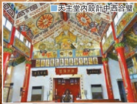
■天主堂內設計中西合璧