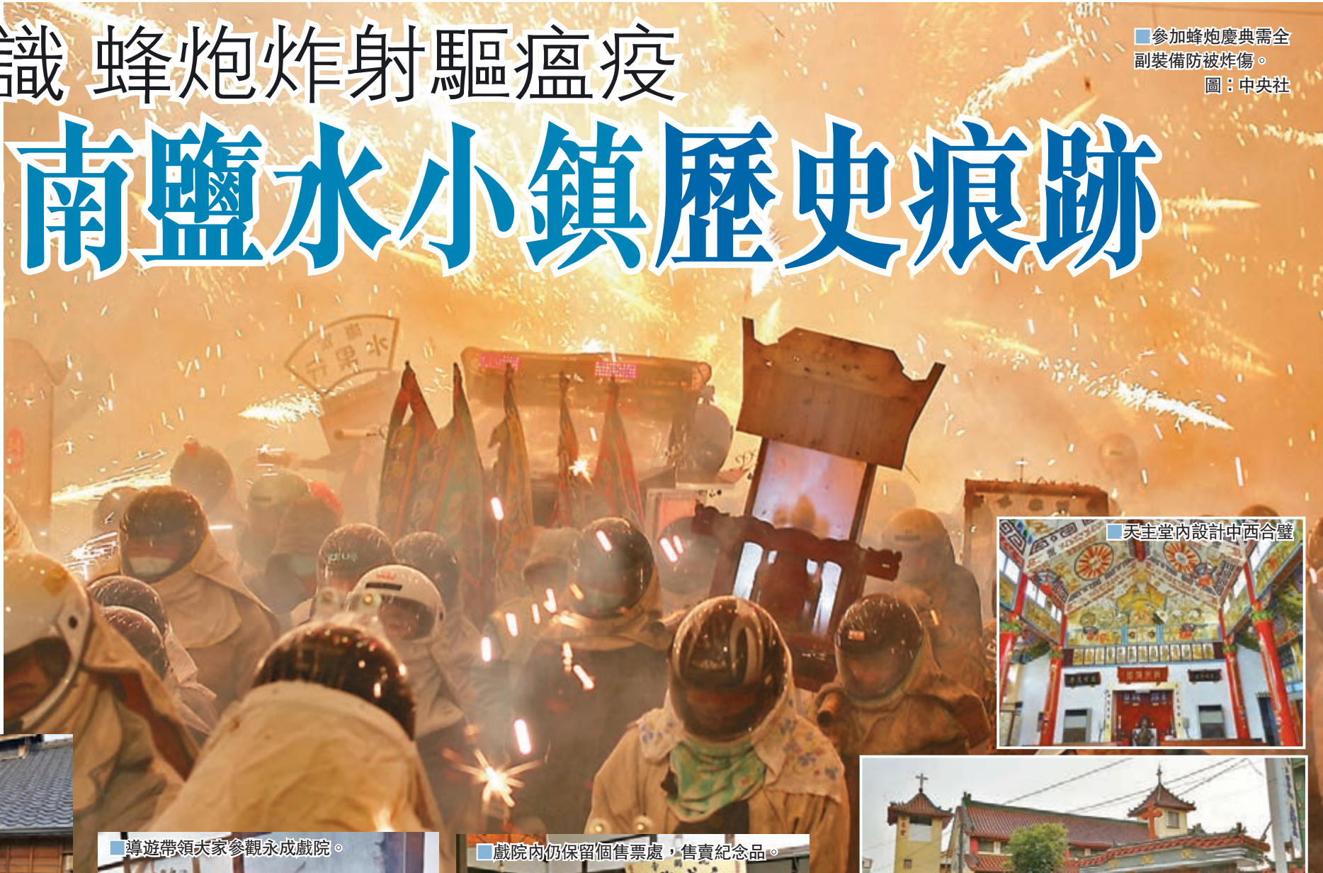
■參加蜂炮慶典需全副裝備防被炸傷。