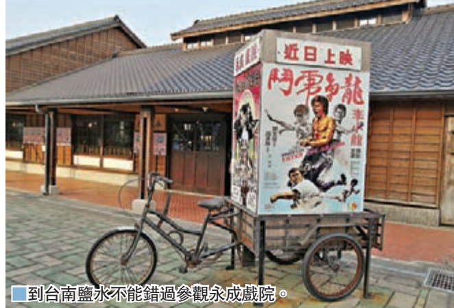
■到台南鹽水不能錯過參觀永成戲院。

台南鹽水鎮有個出名的習俗叫蜂炮，每年元宵前夕舉行，為民祈福。今年遇上新冠肺炎，照常於農曆正月14日舉行，蜂炮起源於要把瘟疫趕走，所以台南人希望蜂炮活動能為世界祈福，早日脫離新冠肺炎疫情影響。