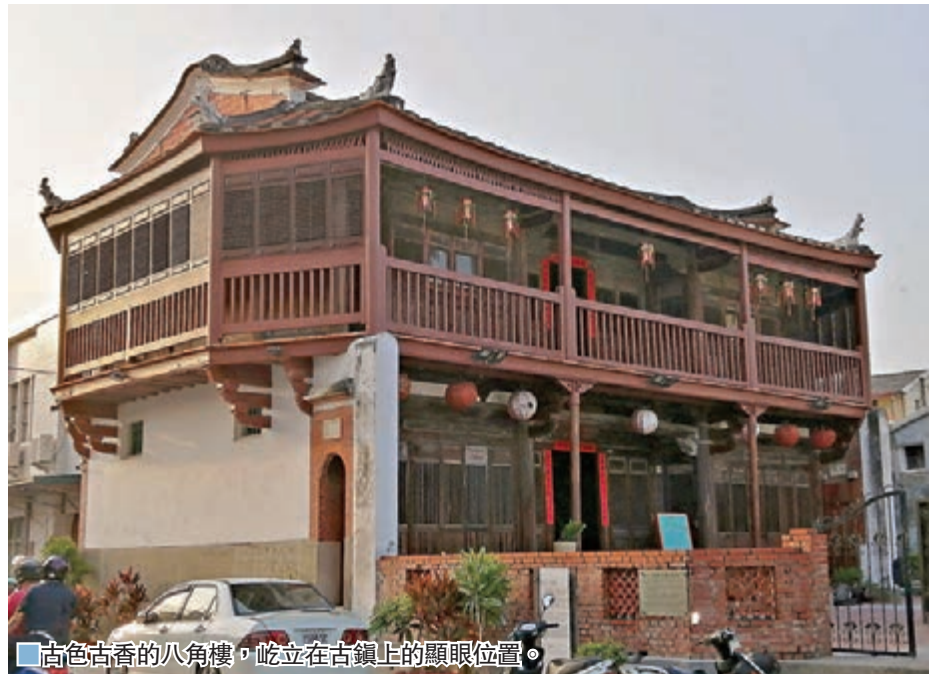
■古色古香的八角樓，屹立在古鎮上的顯眼位置。

蜂炮活動為期2天2夜主要是神轎繞境行程，繞境隊伍將從鹽水武廟為起點，分5條路線繞行鹽水各聚落（村落）。由在地商家、團體，或個人製作大小炮城，在繞境隊伍抵達時「攔轎」燃放，有人會跟著神轎隊伍感受被蜂炮炸射，此舉其實有點危險，所以參加者要準備全罩式安全帽、厚棉質外衣或夾克、棉質牛仔長褲、棉質（或真皮）手套、棉質口罩、棉質濕毛巾貼在脖頸、長筒運動（休閒）鞋等7大裝備。到元宵夜，大批人潮湧入鹽水鎮，遊客集中在施放區觀看主炮城燃放表演，有震撼的聲光體驗。