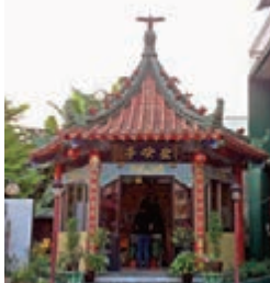
■天主堂設計如中式廟宇

原來，鹽水天主堂在擴建之時，了解到外來宗教要能融入民間信仰才能有效傳播福音，因此在各種表達形式上，都大力與台灣民間信仰結合。這不僅表明了早在1955年，德國籍的胡國臨神父的開明、遠見的想法，也是中西文化融合的最佳闡釋。天主堂內融合了台灣的民間信仰，也充分記載了幾十年來天主教神父在此兢兢業業傳教的痕跡，是民間智慧與寄託的集中體現，讓遊客對此地的歷史文化有更深刻的了解。