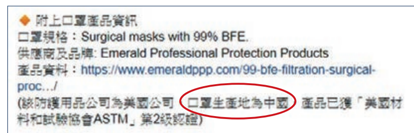
「眾志」事事「反中國」，竟然賣內地口罩(紅圈示)。

述原因，而係繼續攞彩，話「售價為$98一盒，由眾志補貼運費，減輕普羅市民或有需要人士負擔」，並將之前嘅捐款一說轉為，已諮詢「醫管局員工陣線HAEA」意見，稱醫護「難以使用民間募集的防護物資工作」，又藉機抹黑話「因一旦發生意外甚至不幸感染疫症，局方或以此為由，推卸保障員工的責任」云云。