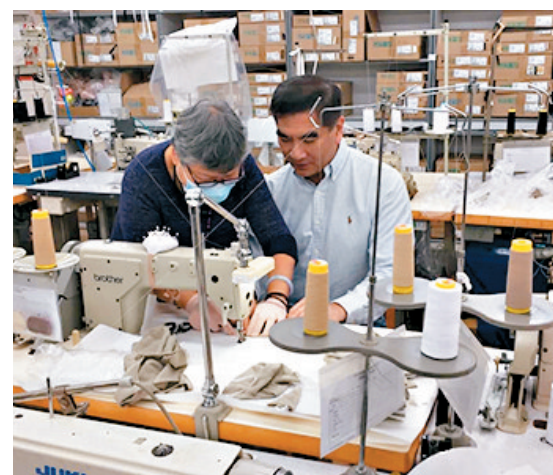
鍾國斌指，目前的材料足夠生產70萬個口罩。

香港文匯報訊（記者 杜思文）為解決市民的「口罩荒」，自由黨黨魁鍾國斌曾提出可生產能重複使用的抗菌布口罩。他昨日在facebook貼出布口罩生產線的照片，表示希望將口罩盡快推出，但最重要先收到檢測報告，相信不會等太久。