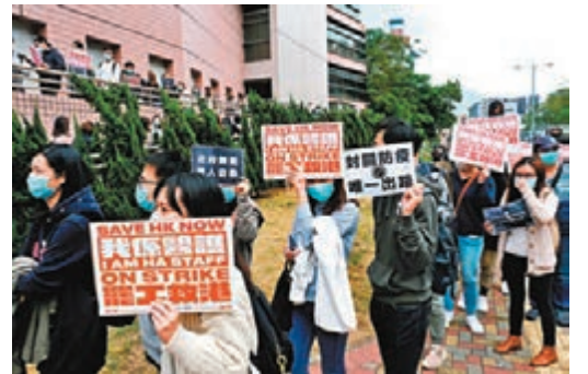
▲醫護罷工置病人生死於不顧。圖為醫院人員在醫院外示威。資料圖片