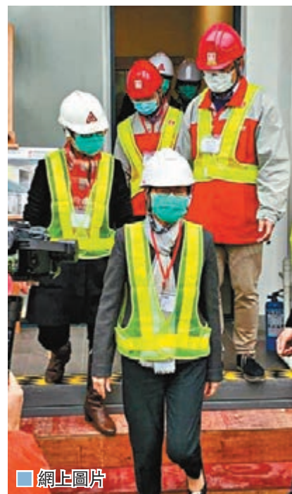
網上圖片 網昨昨日流傳圖片，顯示特區行政長官林鄭月娥疑似到鯉魚門公園度假村檢疫中心視察。日前，青衣長安邨康美樓發生懷疑首宗「樓上傳染樓下」確診個案後，衛生署撤離全座樓A07室單位居民，康美樓居民分批入住4個檢疫中心隔離，包括鯉魚門公園度假村。 ■香港文匯報記者 鄭治祖