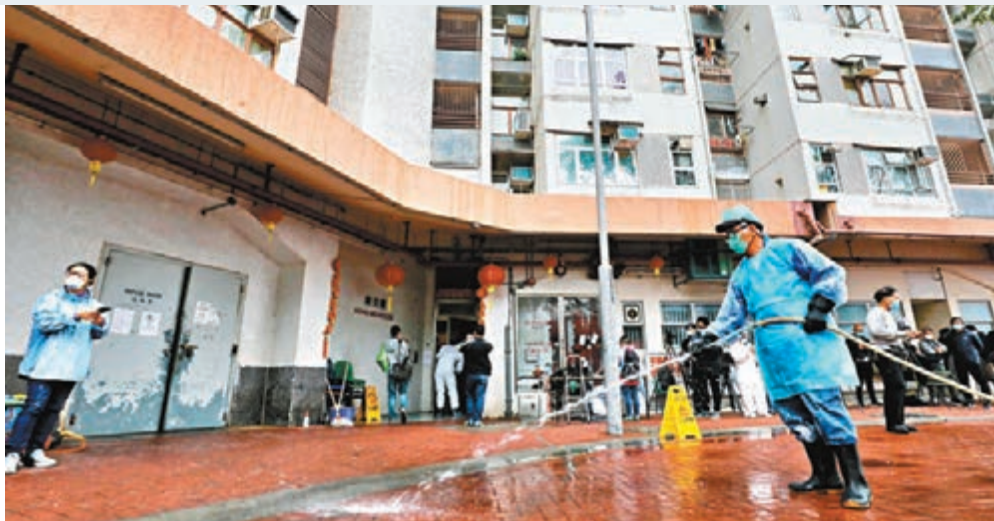
■政府對康美樓最後一位07單位住戶展開撤離游說。圖為工作人員在康美樓做清潔。