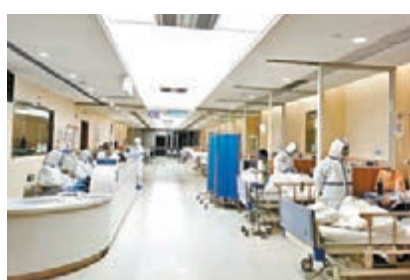
亞心總醫院擬增加床位收治療症患者。

病房的病人進行分流，達到出院標準的病人安排盡快出院，不能出院的病人轉運到其他對口醫院。該院又將兩人間的病房改成三人間，以增加更多的床位。此外，亞心總醫院還要短時間內完成調集人員進行培訓，盡快備備防護物資，解決醫務人員的吃住等問題。院方表示，該院400張床位全數投入使用還有一個過程，影響投用進度的因素，一方面是防護物資緊張，一方面是春節期間建設能力不足。該院將遵循改建完一批、投入使用一批的原則，盡快緩解發熱病人床位緊張問題。亞心總醫院董事長謝俊明曾經表示：「我願意拆盡我這『有限』的力量，來