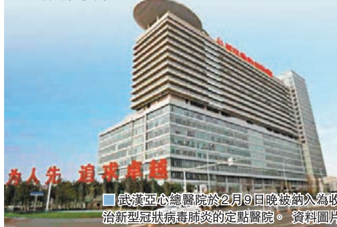
武漢亞心總醫院於2月9日晚被納入為收治新型冠狀病毒肺炎的定點醫院。

記者昨日聯絡李先生，他表示身體虛弱，暫時無法接受訪問。武漢亞心總醫院告訴香港文匯報記者，目前李父仍在ICU病房，但並無生命危險，醫院向李父提供輸氧和輸液等治療；李先生病情較其父輕，目前在普通病房接受治療。兩人目前均狀態平穩。