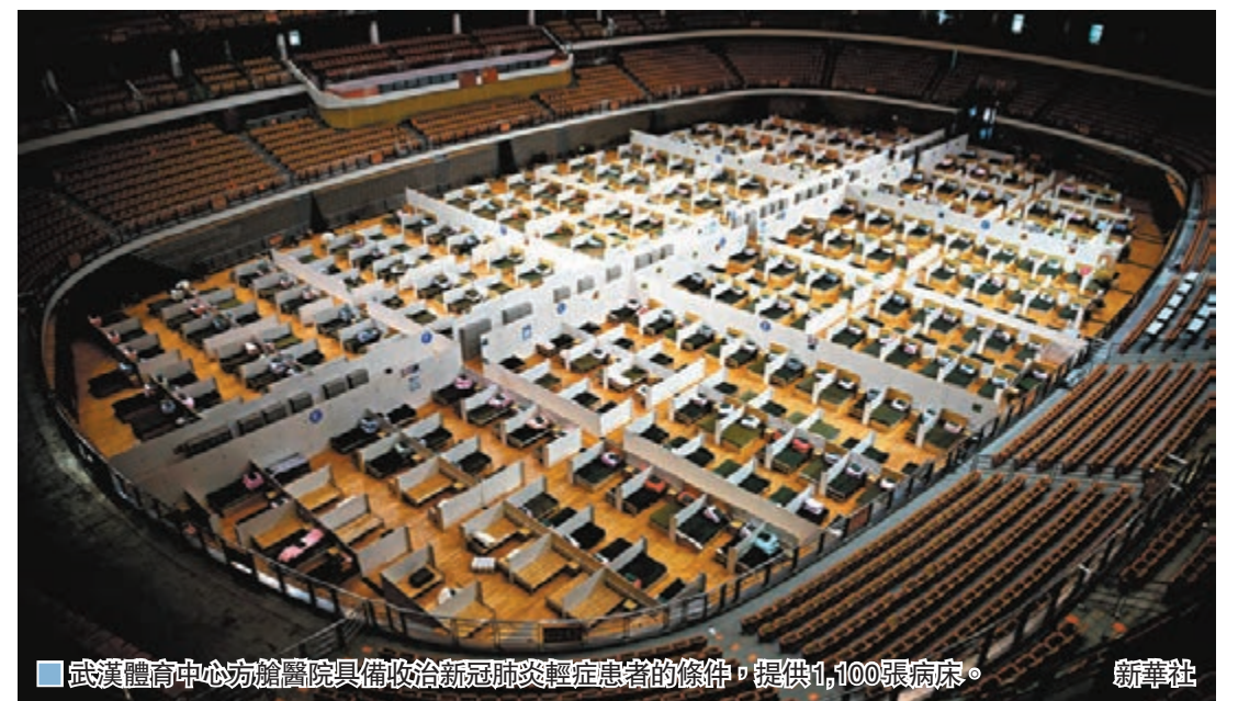
武漢體育中心方艙醫院具備收治新冠肺炎輕症患者的條件，提供1,100張病床。