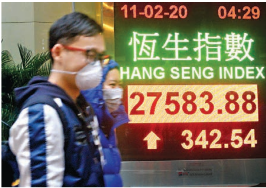
港股昨日升342點收復27,500點水平，不少抗疫概念股繼續炒上。中新社

因疫情令網購訂單急增的港視(1137)，周一曾急升逾三成創新高，該股昨日收市後即開動「抽水機」，有消息引述銷售文件披露，港視計劃以每股5.15至5.35元，