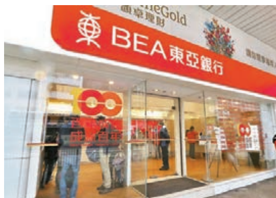
東亞等港銀紛紛推出措施助客戶抗疫。

香港文匯報訊(記者 馬翠媚)再有銀行出招抗疫，東亞銀行推出個人客戶物業按揭延期供款計劃，最長半年，同時按揭、個人貸款和信用卡的客戶可申請豁免逾期手續費和費用，而針對企業客戶推出的措施，包括所有商業貸款、按揭、的士及公共小巴及公共巴士貸款可申請還息不還本，最長12個月。