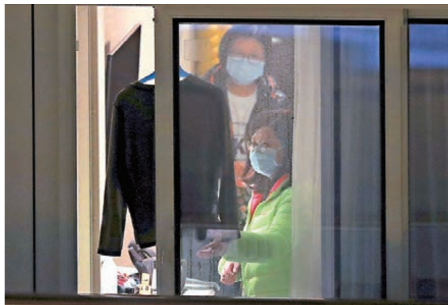
不少輪船客房環境一般。圖為8日「世界夢號」上的乘客。