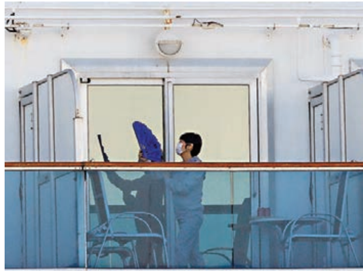
隔離旅客運動打發時間。