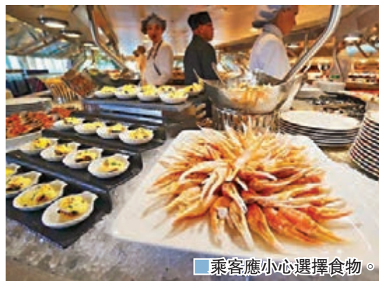
乘客應小心選擇食物。