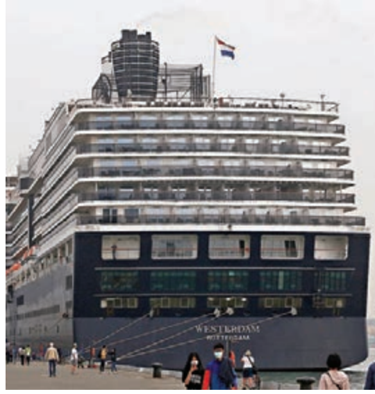
「威士特丹號」2月4日經過高雄。

世衛透露，泰國衛生部門或會派員登船，為乘客和船員逐一檢查，確定他們能否在泰國下船。營運「威士特丹號」的荷美郵輪則強調，船上沒有錄得新型冠狀病毒感染個案，郵輪也未被隔離。綜合報道