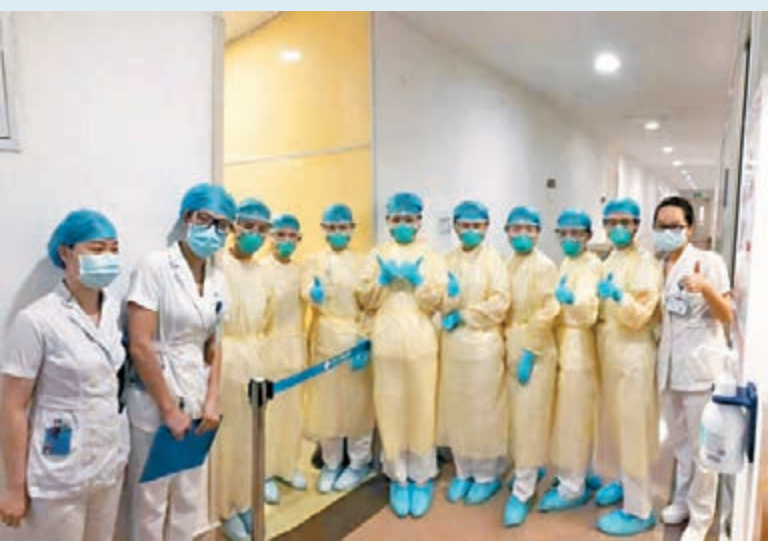
抗擊前線的醫護人員。