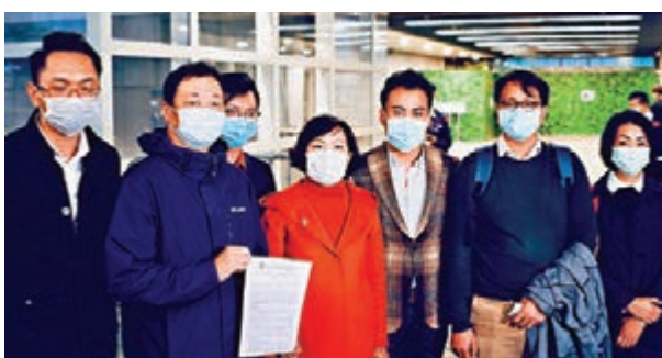
工聯會與陳茂波會晤，就抗疫及即時紓解民困提出多項建議。

工聯會還建議，為零售、飲食、消費等受疫情重創的相關行業的中小企，發放6萬元現金津貼，以紓緩倒閉及裁員壓力。