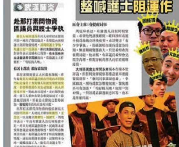
泛暴派5名區議員被批評「擺官威」，大鬧那打素醫院。