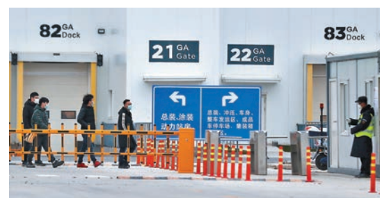
■特斯拉成為中國最早一批復工的車企之一,員工進入廠區均佩戴口罩。

上海市政府則表態會積極幫助特斯拉的復工,市政府新聞發言人徐威早前表示,針對特斯拉等重點生產企業的特點和復工中碰到的實際困難,將全力協調,幫助企業盡快投入生產,能夠正常生產。全國乘聯會秘書長崔東樹認為,隨着特斯拉國產