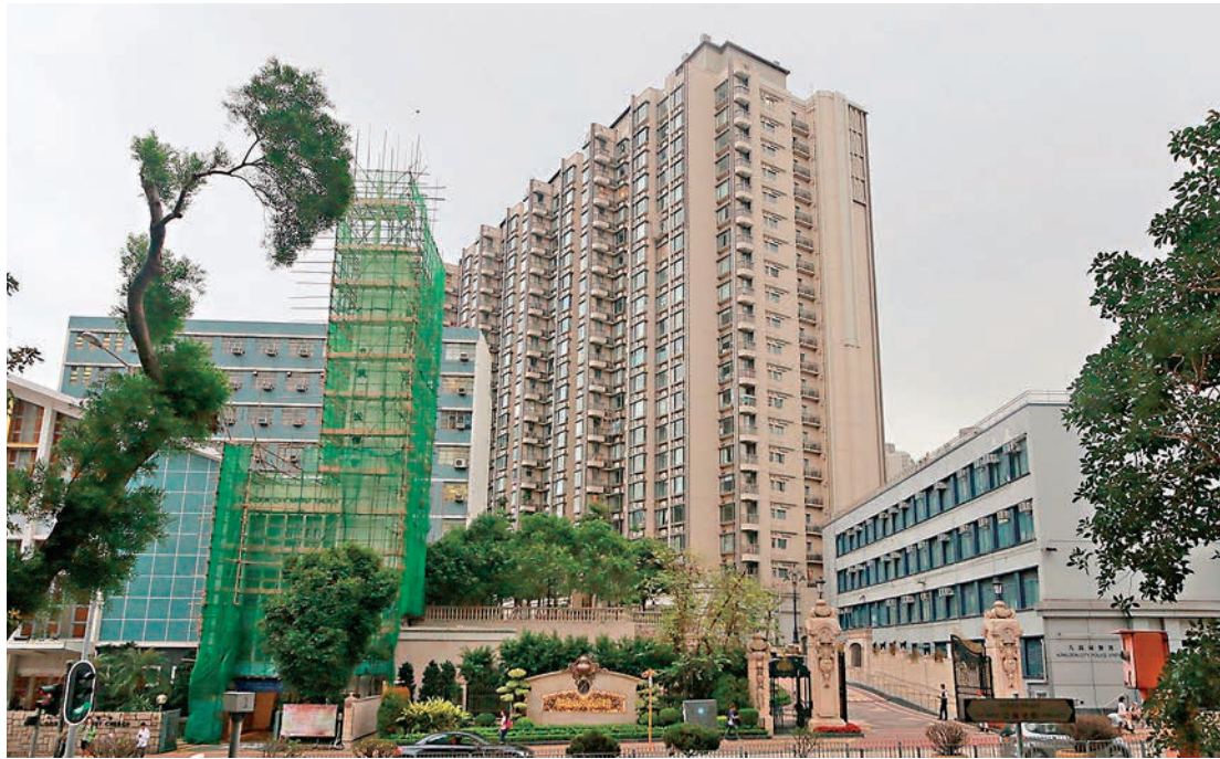
亞皆老街君柏4房單位業主以2,900萬元沽出,賬面蝕767.3萬元或20%,但買家撻訂,反沒收數以百萬訂金。

市場消息指,油塘海灣灣亦錄得首宗蝕讓二手成交,為1A座中層E室,面積295方呎,於上月以570萬元成交,呎價約19,322元。原業主去年5月以634萬元以一手購入,賬面虧蝕一成,更因單位