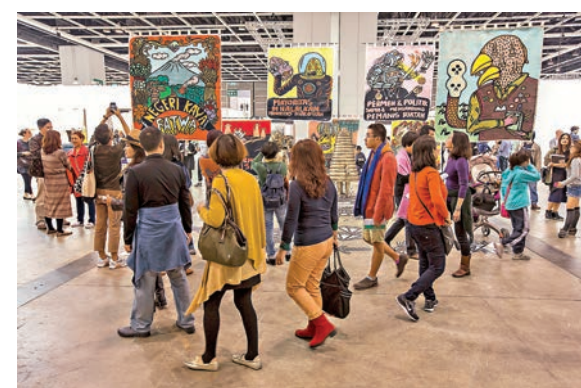
每年在港舉辦的Art Basel均吸引不少市民入場。

與香港一河之隔的廣東省亦宣佈，啟動最高級別的疫情防控制，暫停全市各類文藝演出和活動。其中主力收藏中國現當代藝術，如趙無極、劉野、畢加索等當紅藝術家作品的廣東美術館(He Art Museum)宣佈，押後原定3月下旬的開幕禮。