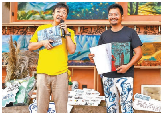
artgogo和上汽·上海文化廣場聯合主辦的「孔龍震大地」2019上海個展，展覽延續了藝高高藝術IP「萬人展」之「無圍牆、免門票」的展覽理念。