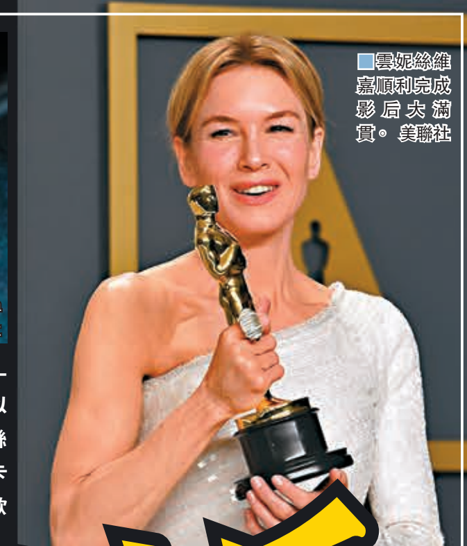
雲妮絲維嘉順利完成影后大滿貫。

香港文匯報訊（記者李慶全、凡文）華堅馮力士（Joaquin Phoenix）憑話題作《JOKER 小丑》與雲妮絲維嘉（Renee Zellweger）以《星夢女神：茱地嘉蘭》大熱首度封奧斯卡影帝、影后。此前，雲妮絲維嘉在《星夢女神》拔頭籌奪得最佳女主角，並再下一城獲得今屆奧斯卡最佳女主角，順利完成影后大滿貫。而美國前總統奧巴馬與夫人米歇爾公司發行的首部電影《美國工廠》拿下最佳紀錄片獎，奧巴馬在社交媒體上第一時間發出祝賀。