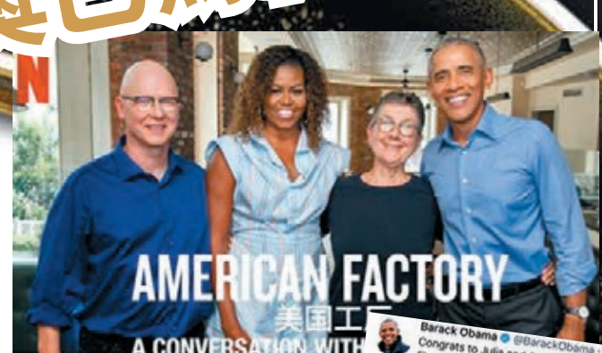
奧巴馬夫婦投資製作《美國工廠》。網上圖片