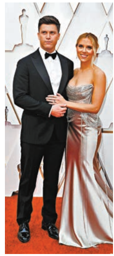
施嘉莉祖安遜偕 Colin Hanks 走紅毯。