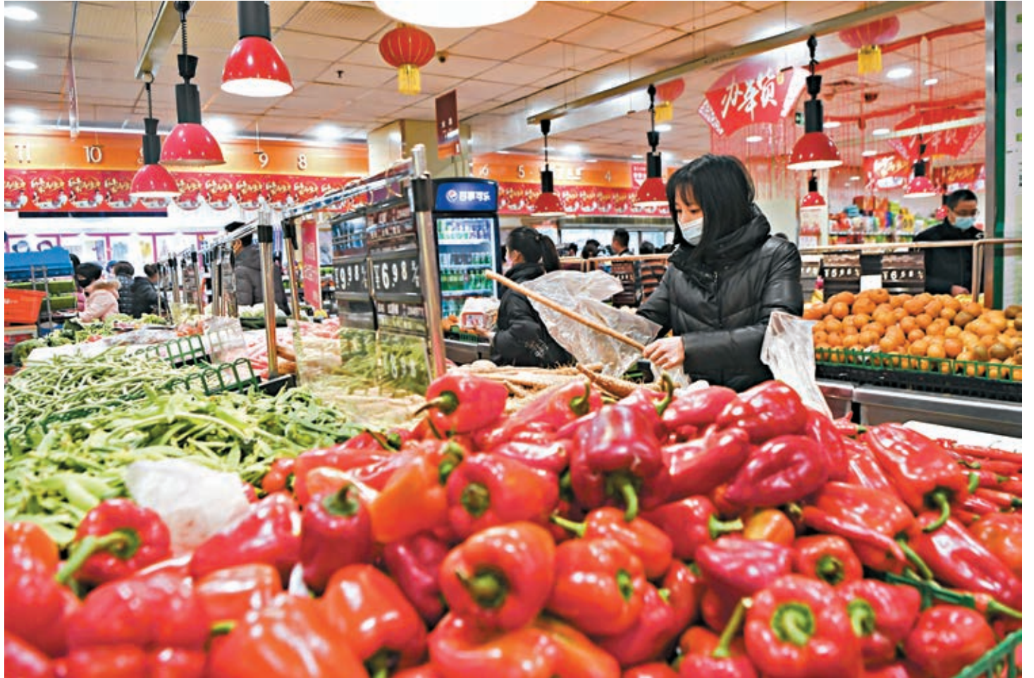
■受春節和新冠肺炎疫情等因素影響，1月內地居民消費價格指數（CPI）同比漲幅攀升至5.4%，為2011年11月以來首次超過5%。圖為消費者在重慶市雲陽縣雙江街道一家超市內選購蔬菜。

此外，在燃料、旅遊、醫療價格增速上行帶動下，非食品價格同比增速升至1.6%，連續第三個月上升。統計局稱，扣除食品和能源價格的核心CPI同比上漲1.5%，漲幅比去年12月份擴大0.1個百分