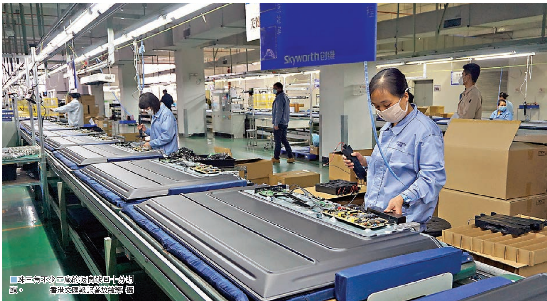
■ 珠三角不少工廠的返崗缺口十分明顯。香港文匯報記者敖敏輝攝

香港文匯報訊(記者 周琳 北京報道)疫情發生後,多家外資企業暫時關閉在華分店或工廠,引發外資撤離及中國在全球供應鏈中地位的擔憂。對此,商務部新聞發言人高峰昨日在京應詢表示,中國總體吸收外資的綜合競爭優勢沒有改變,將加大對外資企業的服務力度,協助外資企業積極應對疫情。高峰介紹,疫情發生以來,各級政府都在積極幫助外資企業應對疫情挑戰。商務部近日下發通知,指導各地加強對外資企業的服務和保障,同時優化創新招商引資工作,繼續推動外資大項目落地。受疫情影響,有部分國家限制中國的船隻,中國的部分工廠也因無法正常生產,面臨出口訂單違約的問題。對此,高峰指出,正在密切關注疫情可能對外資產生的影響。有關部門和地方政府正在積極幫助企業,一些地方政府已經出台了支持政策,一些具備條件的外資企業正在恢復生產。他強調,當前沒有理由採取對國際貿易進行干預的措施,中國正在全力以赴應對疫情,我們有信心、有能力、有把握打贏疫情防控阻擊戰。世衛組織也高度評價中方付出的努力和取得的進展,強調不建議限制轉移、貿易與流動。希望各國充分顯示團結與合作,共同努力,戰勝這場疫情,為國際貿易的正常開展創造便利條件。