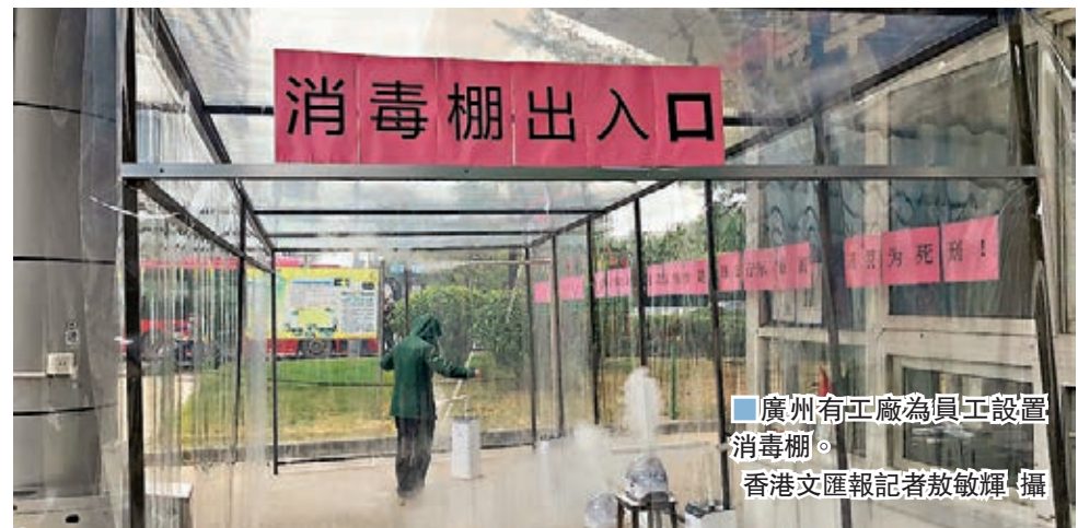
■ 廣州有工廠為員工設置消毒棚。