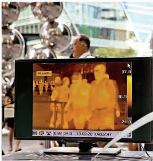
部分商廈設置紅外線體溫檢查器材。