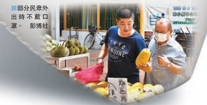
部分民眾外出時不戴口罩。

新加坡確診首宗病例後，當地人已開始搶購口罩，促使當局在1月30日宣佈向所有國民派發520萬個口罩，平均每戶4個，不過到了原定截止派發的2月9日，仍然只有約54%民眾領取了口罩，當局唯有宣佈將計劃延期。當地網媒分析，政府派口罩乏人問津，一方面是每戶4個的數量太少，另一方面是很多人已經預先搶購口罩。