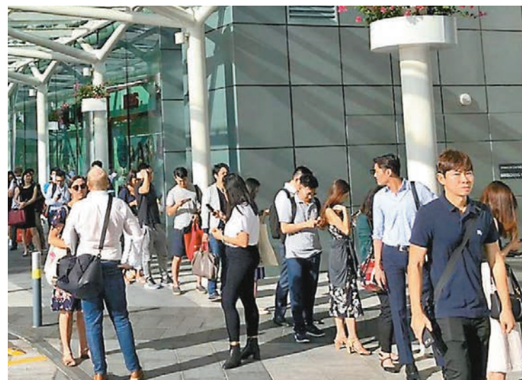
大批白領排隊量體溫。