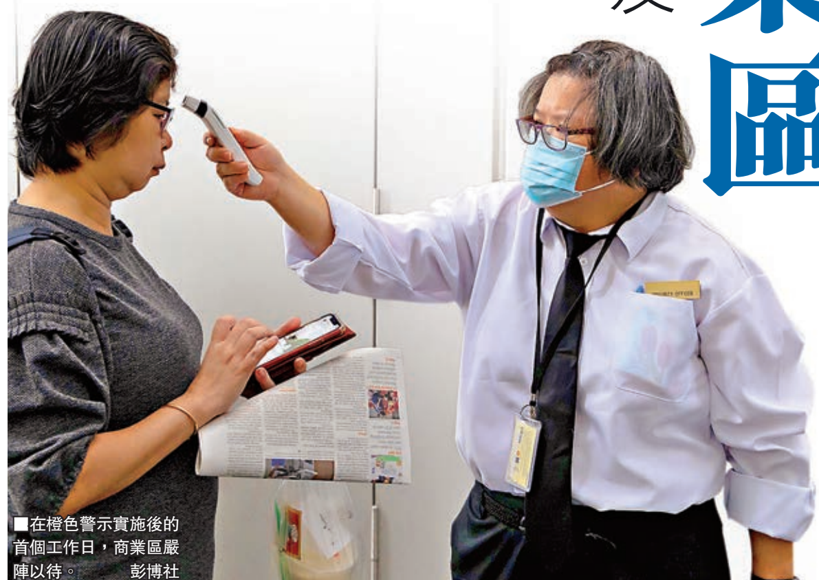
在橙色警示實施後的首个工作日，商業區嚴陣以待。

英國政府昨日宣佈新冠肺炎已經對公共健康構成嚴重及即時威脅，容許政府調動更多資源應對疫情。