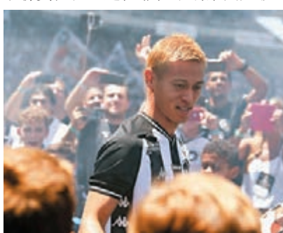
本田圭佑和球迷見面。

日本中場球員本田圭佑於巴西時間8日亮相當地新東家保地花高，和現場超過1.3萬名球迷見面，開啟其德甲聯賽征程。這位兼任柬埔寨國足教練的33歲日本前國腳說：「在抵達機場時我強烈地感受到這種熱情，我一生中還未見過如此美妙的事，球迷的這種熱情也更加堅定了我在這裡踢球的決心。」本田去年11月短短為荷甲球隊維迪斯踢了4場比賽後便宣告閃電離隊。