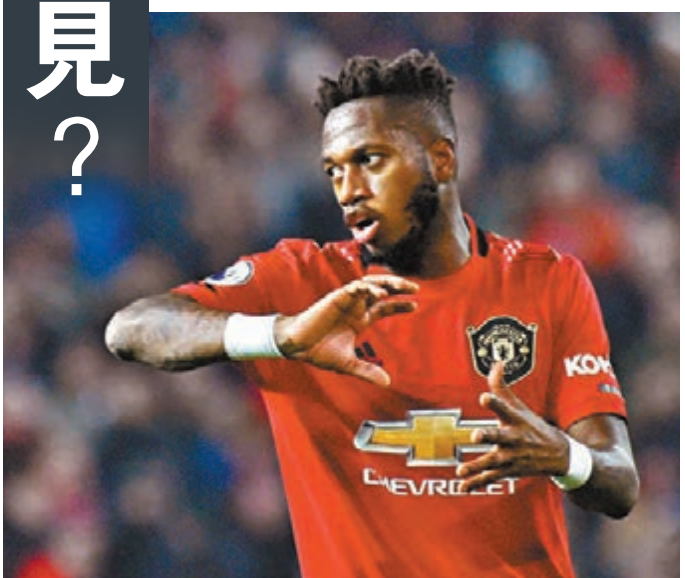
費特洛迪古斯對一些隊友有微言。