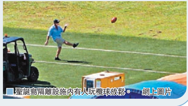
聖誕島隔離設施內有人玩球放鬆。網上圖片