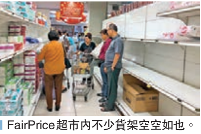
FairPrice超市內不少貨架空空如也。