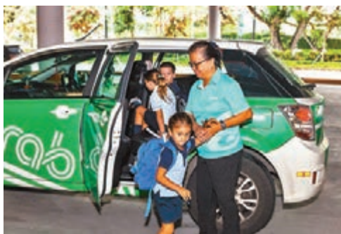
GrabShare因應疫情暫停服務。

新型冠狀病毒肺炎持續肆虐，新加坡上周五宣佈將疾病爆發應對系統(DORSCON)級別，提升至次高的橙色後，電召車應用程式Grab昨晚宣佈，從昨日起暫停當地的GrabShare共乘車服務，以減少乘客接觸機會，防止疫情擴散。