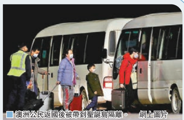
澳洲公民返國後被帶到聖誕島隔離。