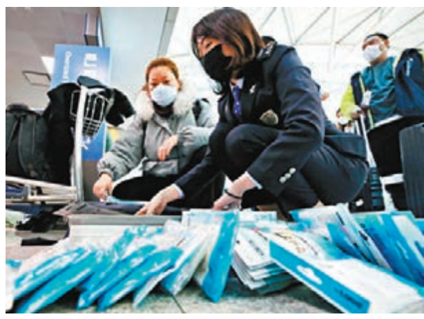
保健福祉部前日則表示，當韓國加強打擊走私口罩走私活動。網上圖片

法務部昨日宣佈，將大幅降低新冠肺炎檢測門檻，包括非法居留者在內的225萬名在韓外籍人士，只要被列入疑似病例，即可在全國124個衛生站及46家民營醫療機構接受檢疫，費用由政府負擔，以防感染病毒的在韓外國人成為「超級傳播者」。