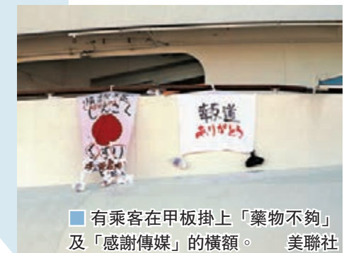
有乘客在甲板掛上「藥物不夠」及「感謝傳媒」的橫額。

船上不少旅客需長期服用糖尿病及高血壓藥物，厚勞省稱，當局原本希望由醫生診斷及處方藥物，但目前會以緊急人道因應方式給予藥物，昨日已提供約500人份量急需使用的藥物上船。