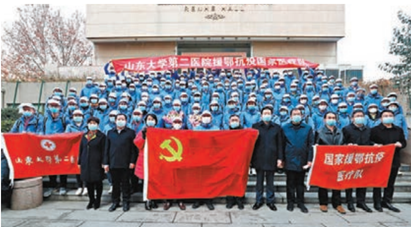
山東大學第二醫院131人醫療隊馳援湖北。

「雖然是年輕人，但也有5年的重症護理經驗。去湖北，家裡人還是有些擔心，但我希望，能盡自己一分力，讓疫情早點得到控制。」