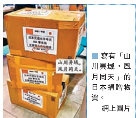
寫有「山川異域，風月同天」的日本捐贈物資。網上圖片

日本政府和日本許多地方、企業近日主動向中方捐贈口罩、護目鏡、防護服等防疫物資。其中，一些捐贈給武漢的物資包裝箱上印着「山川異域，風月同天」。