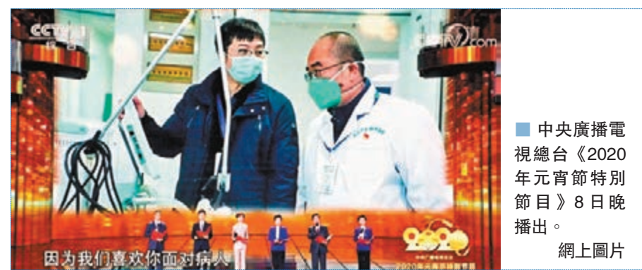
中央廣播電視總台《2020年元宵節特別節目》8日晚播出。

配樂詩朗誦《中國阻擊戰》，深度刻畫了全國人民萬眾一心凝聚家國情、眾志成城彰顯山河志的偉大中國精神。有網民評價稱，《中國阻擊戰》展現了中國人民團結一心、同舟共濟的精神風貌，在阻擊疫