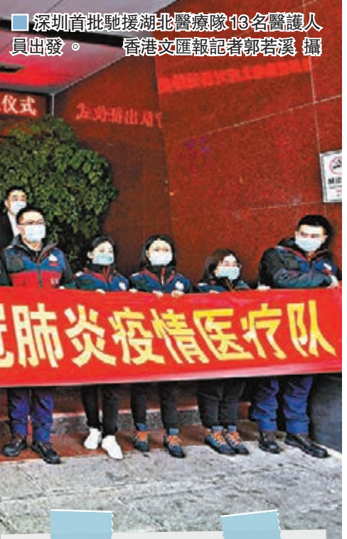
深圳首批馳援湖北醫療隊13名醫護人員出發。