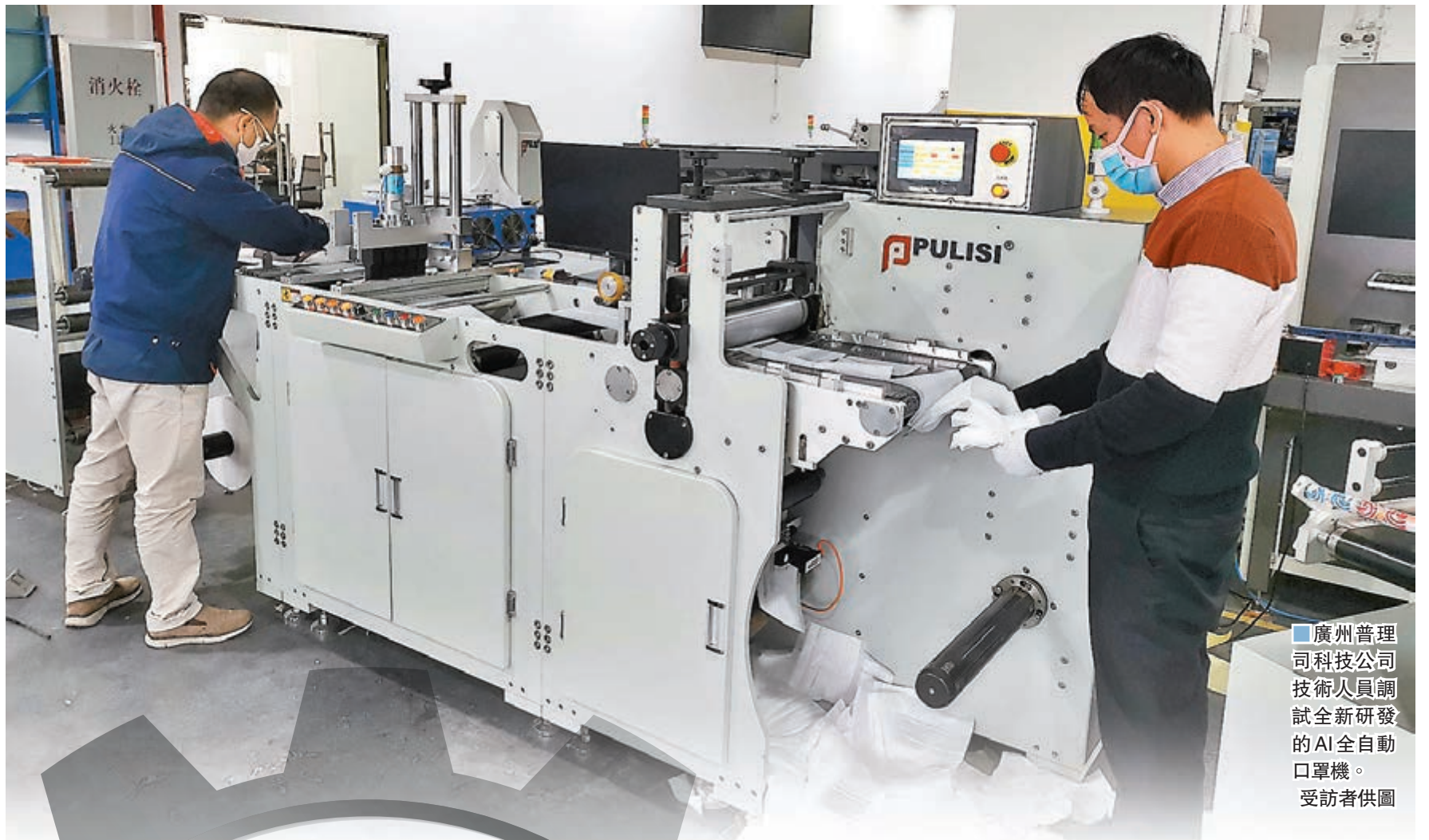
廣州普理司科技公司技術人員調試全新研發的AI全自動口罩機。

廣東省工信廳相關負責人表示，目前，廣東省內90%以上的防控物資生產企業已經開工復產，同時，不少符合條件的企業，通過轉產，進一步增強了相關物資的產能，相信全省復工企業防控物資短缺問題將得到極大改善。