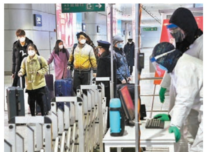
山東青島昨日迎來復工返程客流高峰。圖為青島火車北站旅客通過體溫檢測點。新華社

「吃飽」才有抵抗力。與防疫相比，穩妥地復工復產同樣重要。政府的有形之手和市場的無形之手打好「組合拳」，就能更快地擊倒困難，把疫情對經濟的影響降到最低。