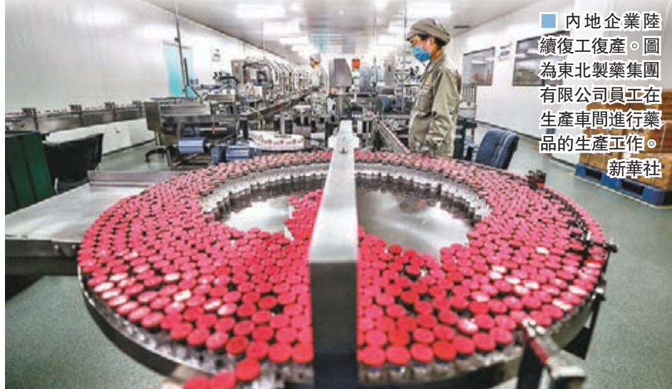
內地企業陸續復工復產。圖為東北製藥集團有限公司員工在生產車間進行藥品的生產工作。

資企業加班加點生產防疫產品，從境外採購醫用物資、捐款捐物，彰顯了強烈的企業社會責任意識。山東省商務廳會同有關部門多措並舉，印發了《山東省商務廳關於應對當前疫情做好外經貿工作的意見》，出16條措施，積極協調解決重點外貿型外商投資企業復工難題，通過外商投資企業「服務大使」加強對企業服務。截至2月7日，全省1.5萬多家外商投資企業，已復工755家。