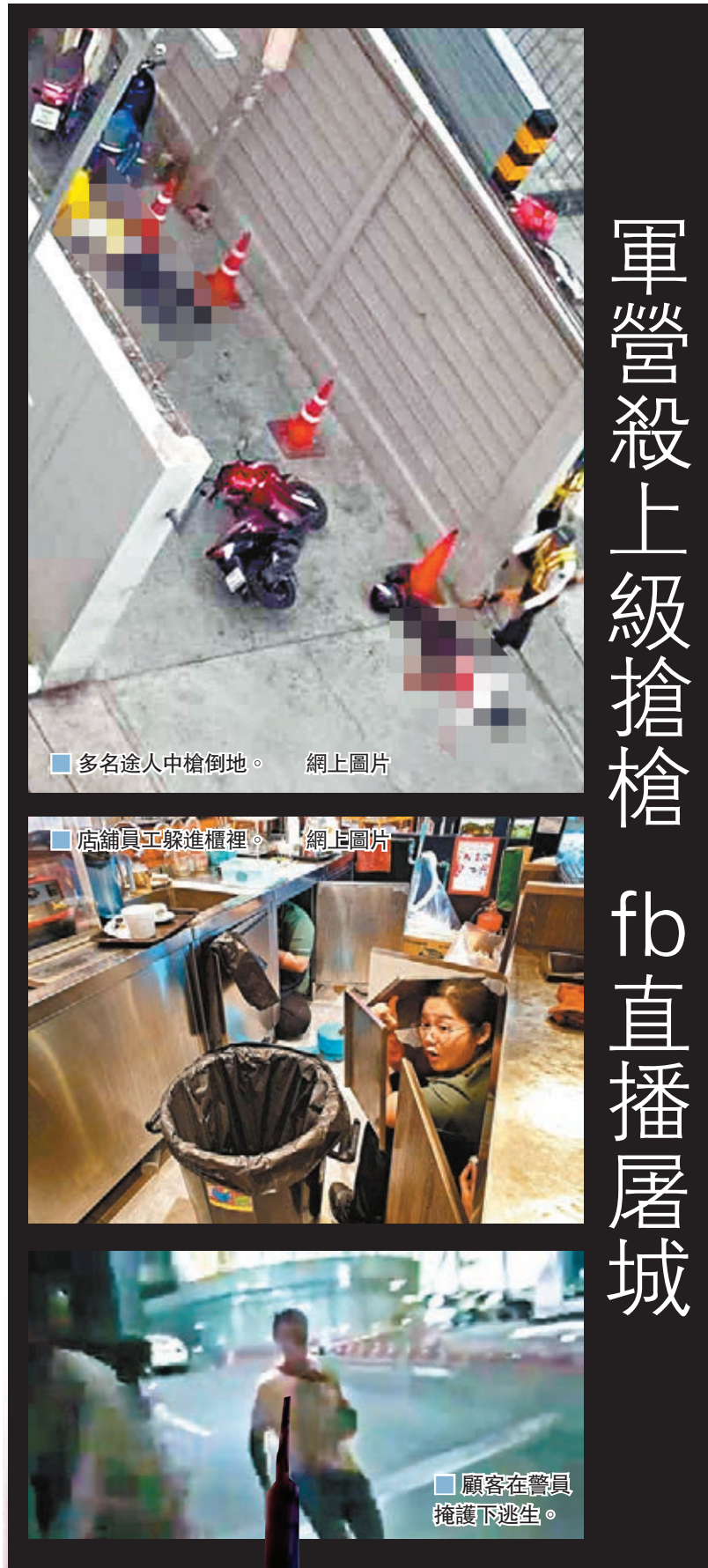
軍營殺上級搶槍 fb直播屠城