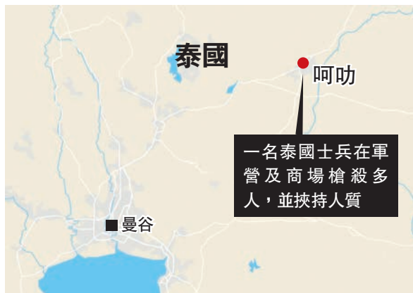
一名泰國士兵在軍營及商場槍殺多人，並挾持人質