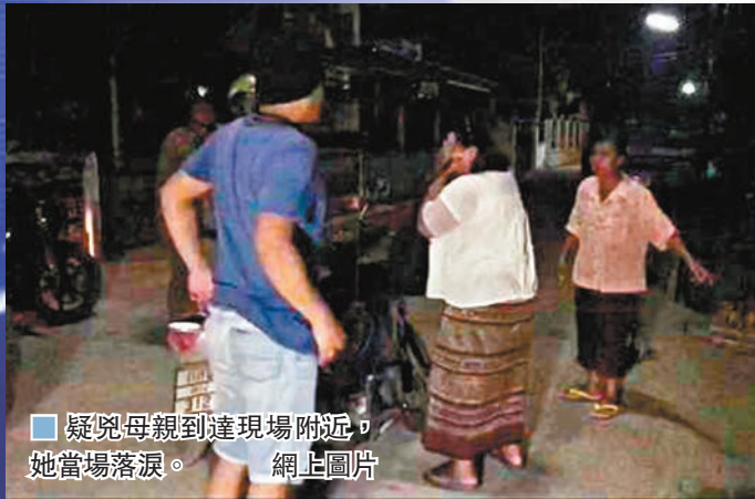
疑兇母親到達現場附近，她當場落淚。