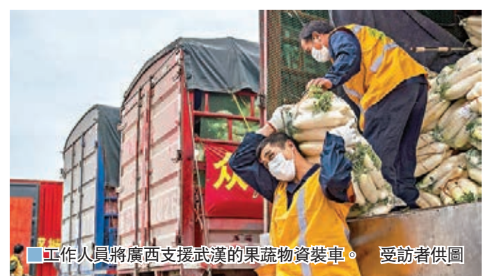
工作人員將廣西支援武漢的果蔬物資裝車。

據悉，廣西已開行3班支援湖北果蔬直達冷鏈專列。廣西將繼續按照「開行一班、準備一班、謀劃後兩班」要求，持續不斷每周開行2班支援湖北果蔬物資直達冷鏈專列。