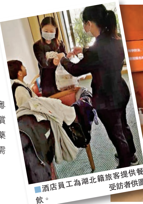
酒店員工為湖北籍旅客提供餐飲。