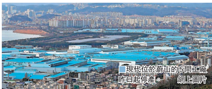
現代位於蔚山的5間工廠昨日起停產。

在全球各地組裝的數以百萬計汽車，均是使用中國製造的零件，其中新型肺炎疫情嚴峻的湖北省，是汽車零件生產和付運的樞紐。據汽車專家指出，在上月底中國農曆新年長假期前，車廠已累積零件庫存，但目前中國許多汽車零件工廠均推遲開工時間，若零件廠無法在下周恢復營運，又或返回中國的班機仍然受到限制，車廠的零件庫存即將用罄，未來數周的發展將是汽車業的關鍵。