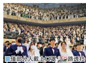
僅部分人戴上回罩。

在場的新人和賓客合共多達約3萬人。參加婚禮的21歲崔姓女大學生表示，「不擔心疫情是騙