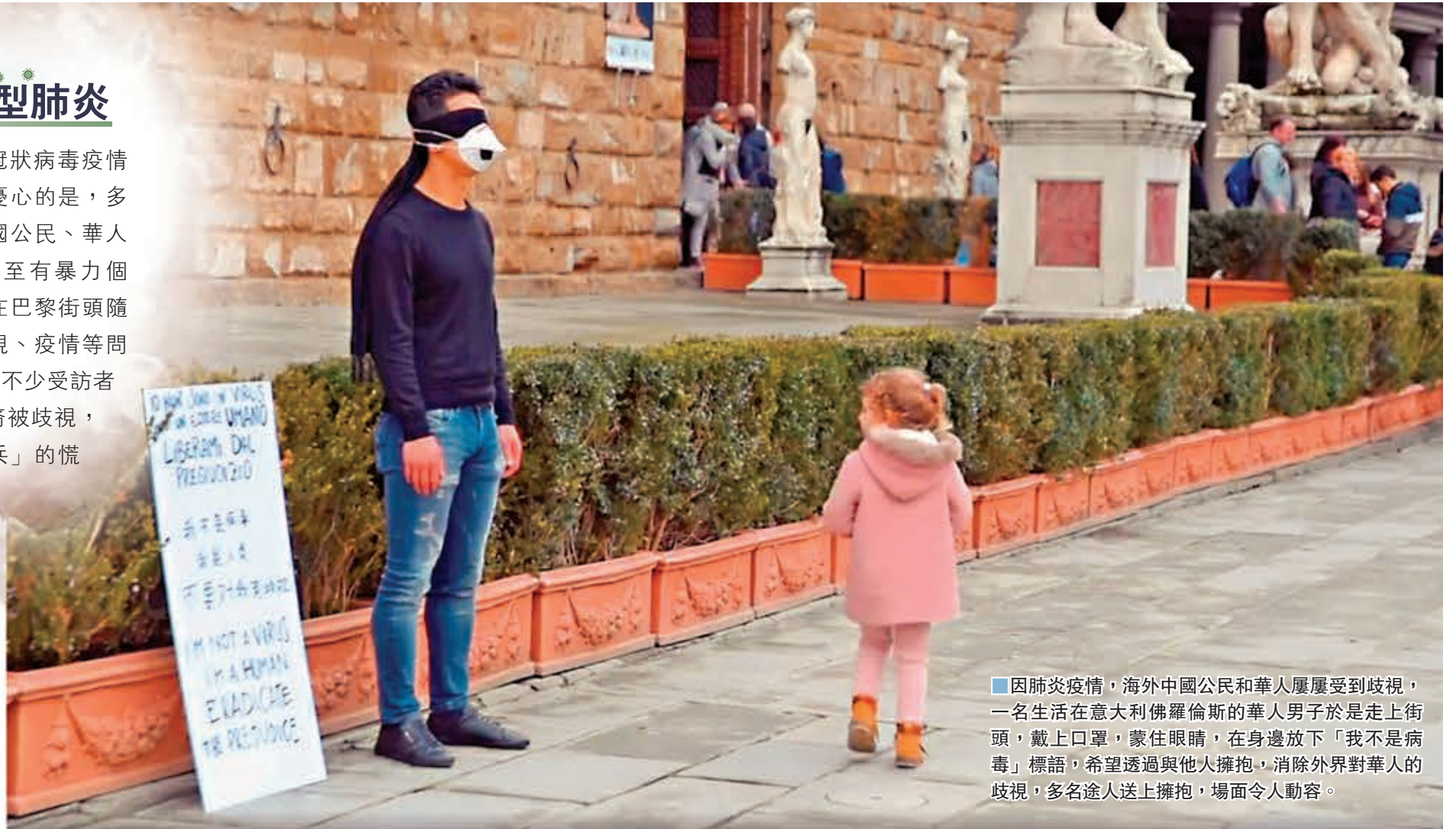
因肺炎疫情，海外中國公民和華人屢屢受到歧視，一名生活在意大利佛羅倫斯的華人男子於是走上街頭，戴上口罩，蒙住眼睛，在身邊放下「我不是病毒」標語，希望透過與他人擁抱，消除外界對華人的歧視，多名途人送上擁抱，場面令人動容。