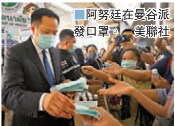
阿努廷在曼谷派發口罩。

阿努廷昨日在曼谷一個繁忙的空鐵站入口向民眾派發口罩，他表示發現許多西方旅客不僅不戴口罩，就算派給他們，他們也拒絕取用，對疫情全不理會。阿努廷說會激動，多次使用帶歧視性的字眼「farang」(鬼佬)形容這些西方旅客，稱「亞洲人都有戴口罩，但這些歐洲人卻不戴，真令人失望，我們應將這些人踢出泰國」。