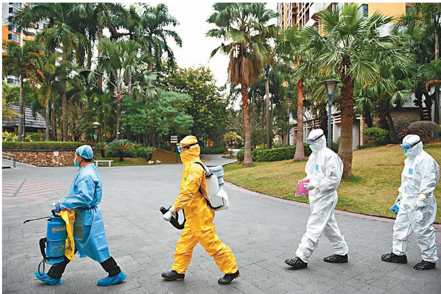
廣東省首次報告新型肺炎死亡病例後，廣州、深圳對所有居住小區(村)實施封閉管理。圖為2月6日工作人員在廣州市白雲區黃石街道白雲尚城社區裡進行消毒和排查工作。

香港文匯報記者昨日下午在廣州走訪發現，各大小區已經開始嚴格執行該通知規定。在廣州荔灣區怡芳苑小區南門，當天貼出三份通告。「非本小區居民，謝絕入內！」的通告十分顯眼。香港文匯報記者看到，有租客出門時忘記攜帶帶有「小區標識」的門禁卡，被拒絕入內，需要等待家人送出門禁卡，並進行登記。此前，外賣、快遞人員可透過鐵門縫隙將物遞給住戶，今次已被禁止，所有物品須放在指定位置，住戶親自到相關位置領取。與此同時，小區內放置高音喇叭，對相關管理措施進行告示，並宣傳相關病毒防控方法。