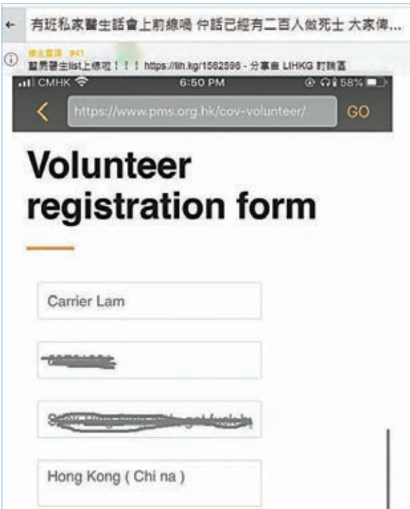
■暴力黃絲填上行政長官林鄭月娥的英文名搗亂，不過就連名字亦串錯。