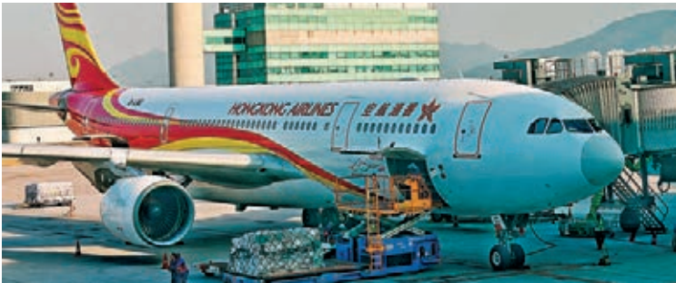
■香港航空宣佈將每天82個航班削減至30個。資料圖片

為協助遏制新型冠狀病毒的傳播，公司會由2月11日起至3月期間，將每天82個航班削減至30個。港航更指，隨著瀰漫全球的不確定性及不斷變化的形勢，疲弱的旅遊需求將有可能持續到夏季，會採取進一步行動以確保公司能持續營運。 港航形容，該公司正面對前所未有的挑戰，必須及時作出有關艱難的決定以確保公司能繼續生存，但強調其員工將繼續保持最高的專業水平及安全標準。