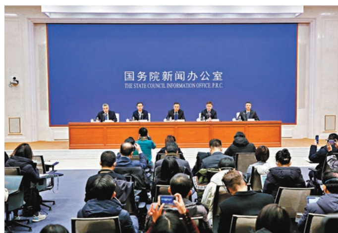
■昨日，中國央行副行長、國家外匯管理總局局長潘功勝出席國務院新聞辦公室記者會表示，疫情緩解後，中國經濟會出現補償性的恢復。

在財政政策方面，余蔚平也表示，中央財政將通過貼息、收儲、稅費等一攬子政策馳援企業渡過難關。財政部聯合央行首次實施「專項再貸款和財政貼息」這樣捆綁發力的政策；對企業多生產的重點醫療防護物資，全部由政府兜底採購收儲；對受疫情影響較大的住宿、餐飲、旅遊、快遞、交通等，給予稅收優惠；允許直接向醫院捐贈享受優惠，對企業和個人捐贈，給予全額稅前扣除，減免相關稅費等。