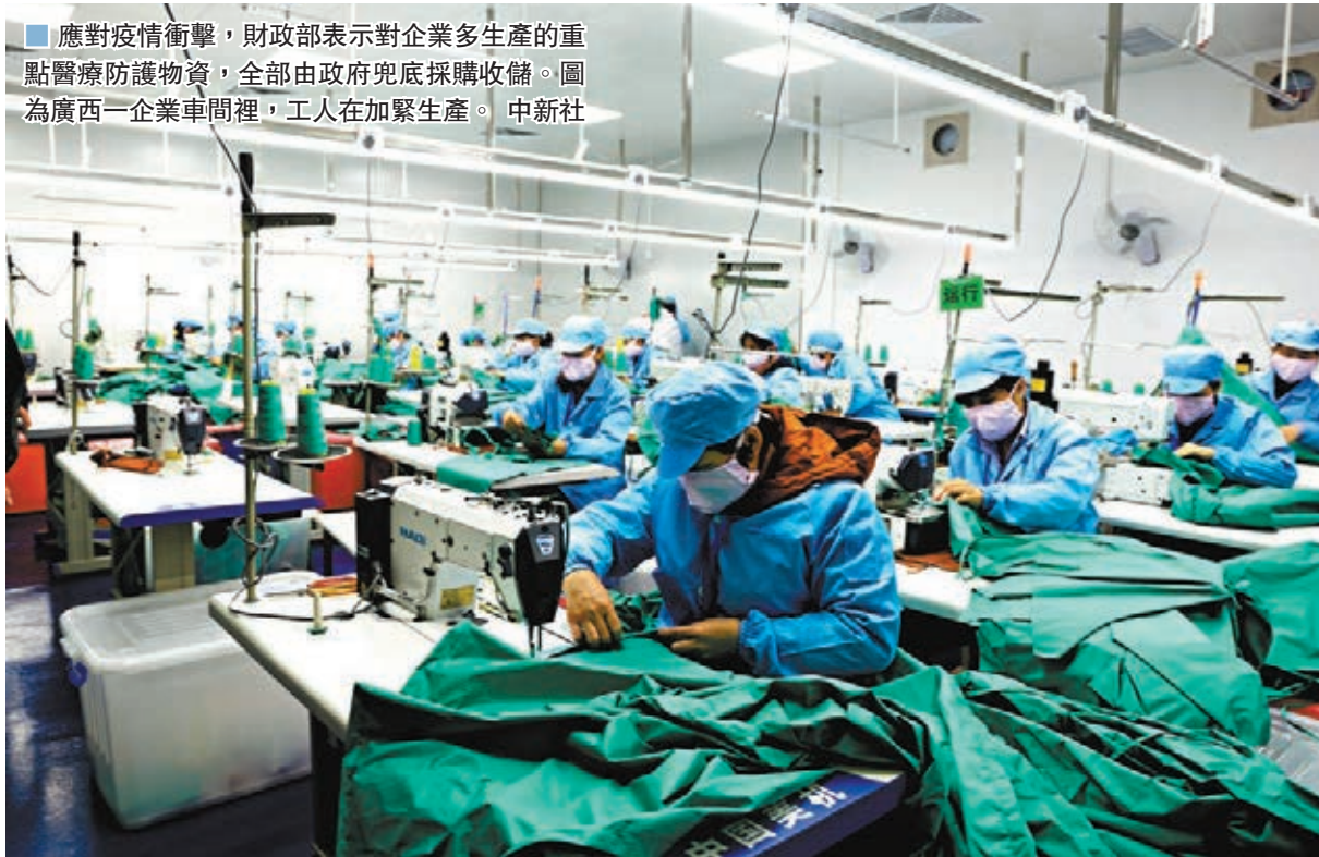
■應對疫情衝擊，財政部表示對企業多生產的重點醫療防護物資，全部由政府兜底採購收儲。圖為廣西一企業車間裡，工人在加緊生產。

「疫情對經濟的影響是階段性的，是暫時的」，潘功勝分析，此次疫情與春節重合，對旅遊、餐飲、娛樂等服務業造成影響，延長假期和推遲開工，對工業生產和建築業也會產生一些衝擊。由此判斷，疫情可能會對一季度的經濟活動造成擾動。