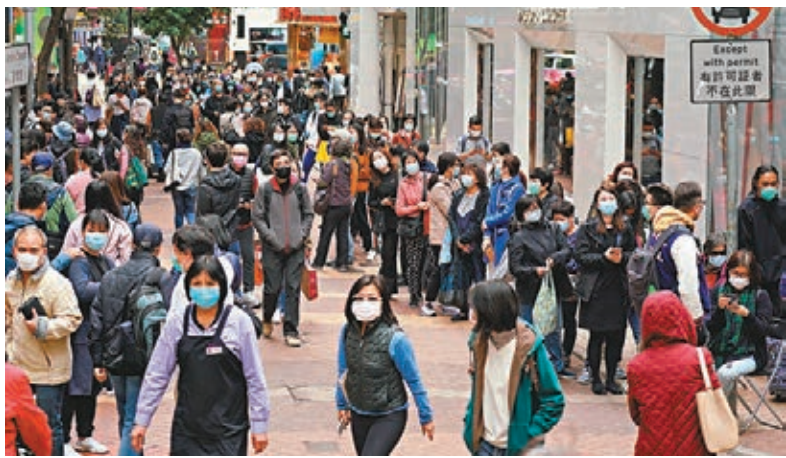
■ 新型冠狀病毒感染肺炎的疫情持續，市面上仍有大批市民搶購物資，惟港股卻持續強勢反彈。

他又重申，通常這類危機事件導致的大跌市，最低點只在恐慌時出現，一旦局勢回穩，低位便不再。由於很多股份價格