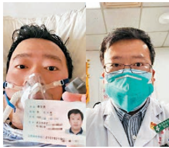
李文亮醫生感染病毒前後的情形。

李文亮醫生的《今日頭條》賬號上,特地用上了卡通蠟筆小新一家四口的頭像。 北京感恩公益基金會在李文亮醫生確診後向他資助了10萬元公益款,撥付公益款給李文亮的原因是,「他的行為客觀上讓更多人對病毒有了提前防範」。昨日晚間,李文亮醫生傳出病危消息後,引發網友集體關注,大家都祈盼奇跡出現,李文亮醫生能搶救回來。