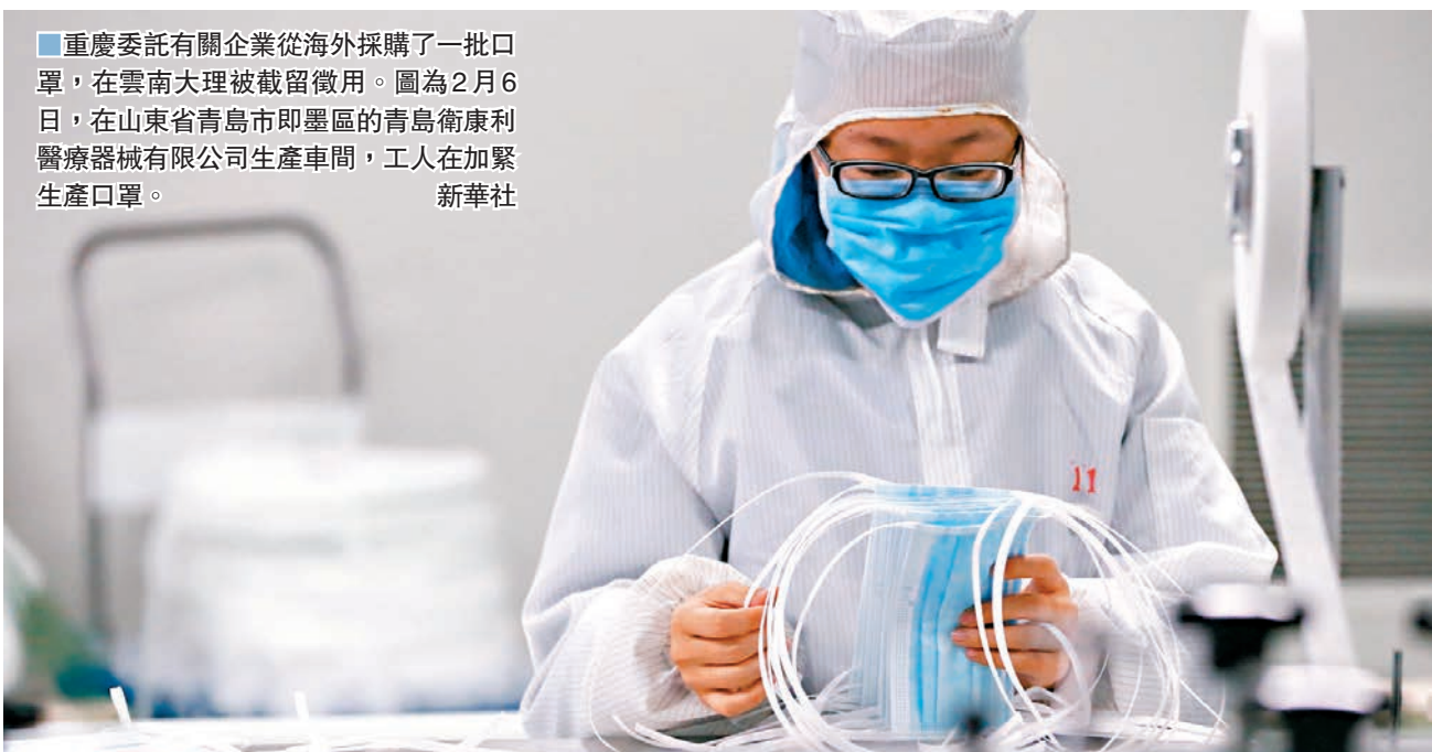
重慶委託有關企業從海外採購了一批口單,在雲南大理被截留徵用。圖為2月6日,在山東省青島市即墨區的青島康利醫療器械有限公司生產車間,工人在加緊生產口單。

《人民日報》昨日也發出評論指,一些地方政府的急迫心理可以理解,但疫情防控是一項系統工程,各地區各部門必須要有大局意識和全局觀念。評論指出,需清晰明確「外地採購、本地生產的物資是否屬於本行政區域內的物資」「縣級以上的地方政府徵用權限是否涵蓋跨省物資」等問題,不能存在模糊地帶,否則不利於各地有序推進疫情防控總體戰。 人民日報海外版「俠客島」專欄則認為,於政治上來說,大理此舉無疑是地方本位主義思想在作怪。對地方來說,再困難都要服從這個大局。如果都從本位主義出發各自為政,互相「截胡」,那將給防疫全局帶來災難性的後果。大理在函件中聲稱「依法實施應急徵用」,也是於法無據。 文章引述《中華人民共和國傳染病防治法》第四十五條明文規定:傳染病爆發、流行時,根據傳染病疫情控制的需要,國務院有權在全國範圍或者跨省、自治區、直轄市範圍內,縣級以上地方人民政府有權在本行政區域內緊急調集人員或者調用儲備物資,臨時徵用房屋、交通工具以及相關設施、設備。文章指出,很明顯,有權跨省徵調物資的只有國務院,大理無權徵調跨省運送的本屬於其他行政區域的快遞物資。「根據目前的疫情數據,截至2月5日24時,重慶累計報告病例389例,黃石累計報告病例566例,大理累計報告病例為8例。很明顯,重慶和黃石需要投入更多的防疫物資。」