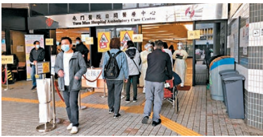
大量醫護人員缺勤，緊急服務嚴重受影響。