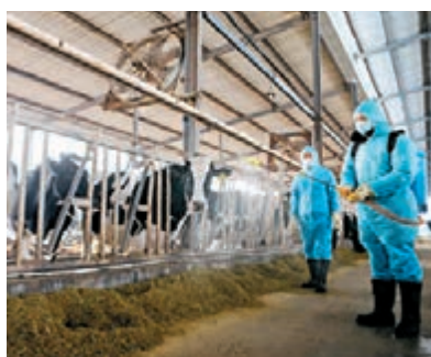
■防疫人員在河北邯山區一家奶牛養殖企業內消毒。