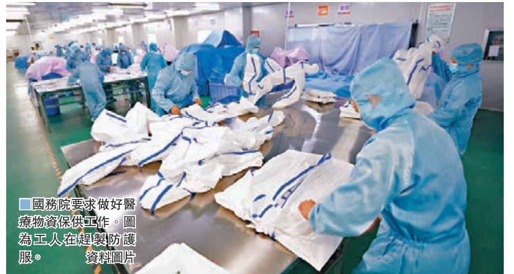
■國務院要求做好醫療物資保供工作。圖為工人在趕製防護服。

香港文匯報訊 據新華社報道，國務院總理李克強5日主持召開國務院常務會議，要求切實做好疫情防控重點醫療物資和生活必需品保供工作，確定支持疫情防控和相關行業企業的財稅金融政策（見表）。