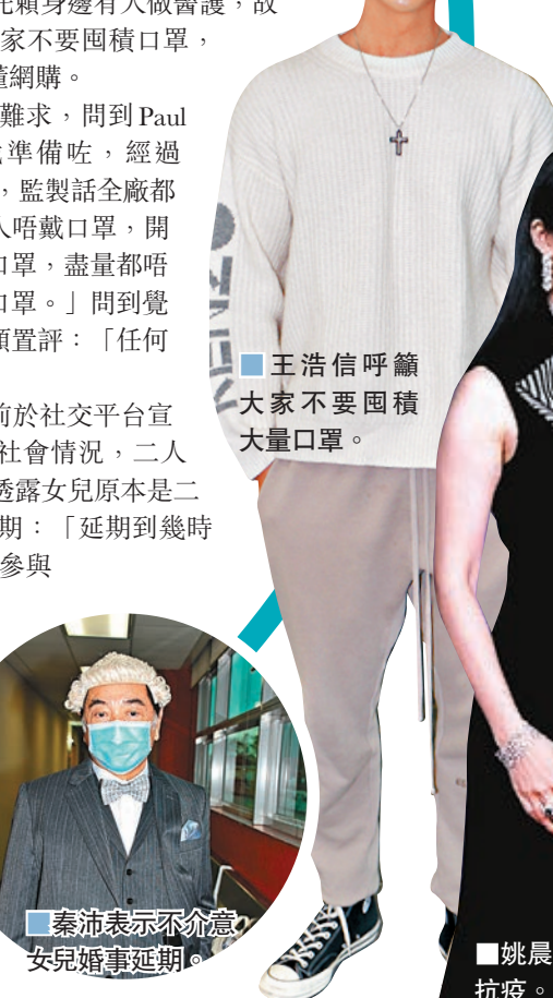
王浩信呼籲大家不要囤積大量口罩。 秦沛表示不介意女兒婚事延期。 姚晨與兒子齊抗疫。資料圖片