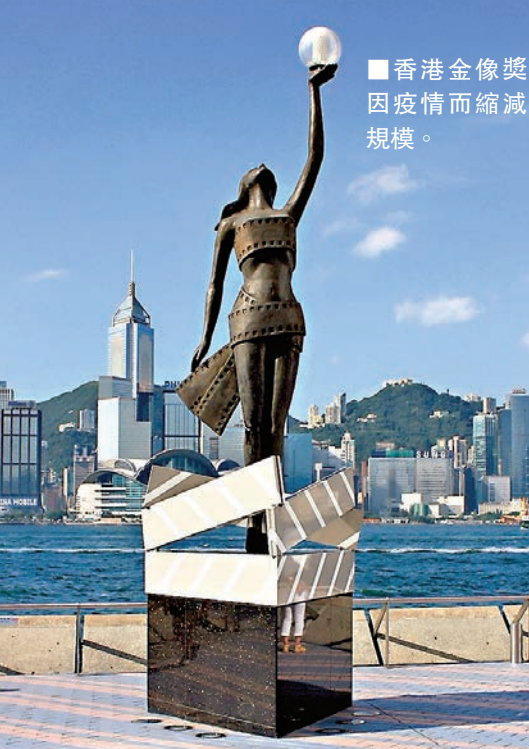
香港金像獎因疫情而縮減規模。

香港自去年6月社會動盪重創表演行業，如今武漢新型冠狀病毒感染肺炎疫情持續，簡直雪上加霜。本港粵劇界劇場商演和神功戲亦受波及，大都取消，八和會員為日薪制，從業員會即時出現手停口停的慘況。身為八和會館主席汪明荃(阿姐)日前在八和會館舉行緊急會議商討對策，當日列席會議除有台前幕後人員，如多位大佬信吳任峰、阮兆輝、龍貫天等等，還有馬逢國立法會議員。阿姐在網上留言：「康文署於1月28日凌晨公佈29號開始停止所有場地的運作。由1月29日起，八和會員陸續收到其他演出場地取消演出的通知。接着有新光戲院、西九戲曲中心，最痛心就是各區的神功戲也紛紛取消演出。從業員會即時出現手停口停的慘況，八和亦與民政事務署聯絡，約見劉江華局長，商討對策。」 每年4月舉辦的香港金像獎亦受疫情影響，金像獎董事局董事田啟文對此表示會把典禮規模縮細，只會邀請頒獎嘉賓和得獎人出席，並取消走紅毯環節，目前暫定4月19日舉行，而地點則從原來的香港文化中心移師到九龍灣國際展貿中心(九展)。