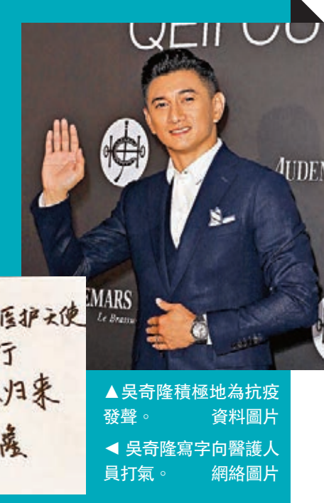
吳奇隆積極地為防疫發聲。資料圖片 吳奇隆寫字向醫護人員打氣。網絡圖片