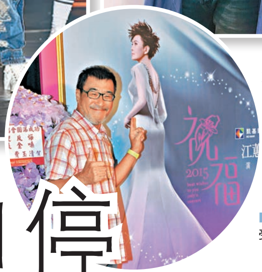
李宗盛演唱會也受疫情影響。資料圖片