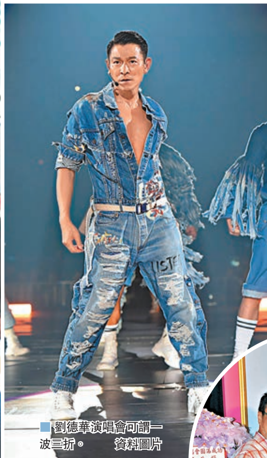
劉德華演唱會可謂一波三折。