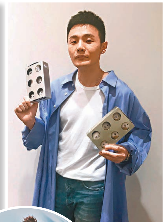
李榮浩為演唱會延期向歌迷致歉。