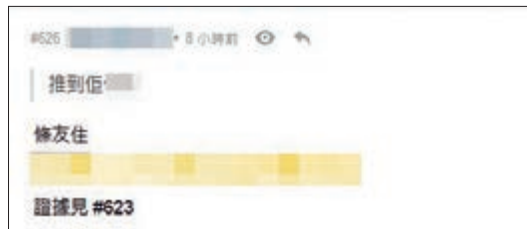
網民對反對罷工的醫護人員大肆起底，公開其疑似住址。