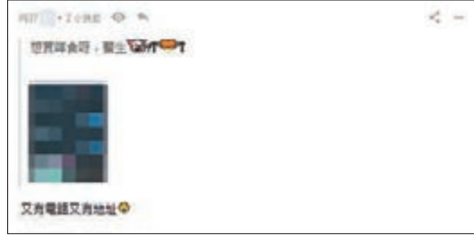
網民公開醫護手機號碼。

香港文匯報訊（記者 姬文風）有醫護工會以政治理由鼓吹連日罷工，但大多數醫護人員仍堅決謹守崗位，有私家醫生及護士更自願到公立醫院協助提供服務，不與「政治掛帥」罷工者同流合