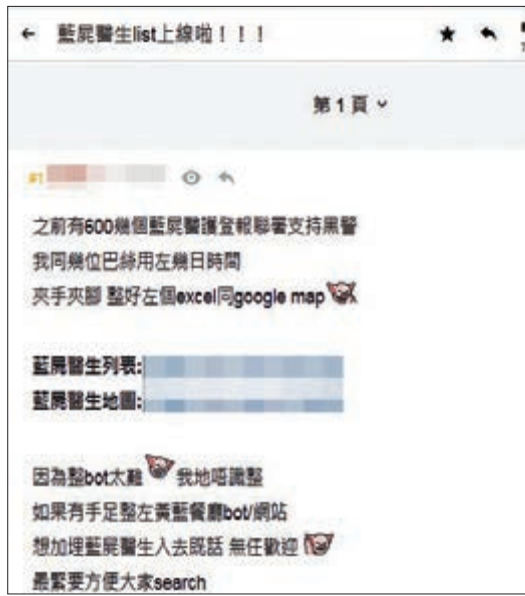
網民公開相關醫護列表。