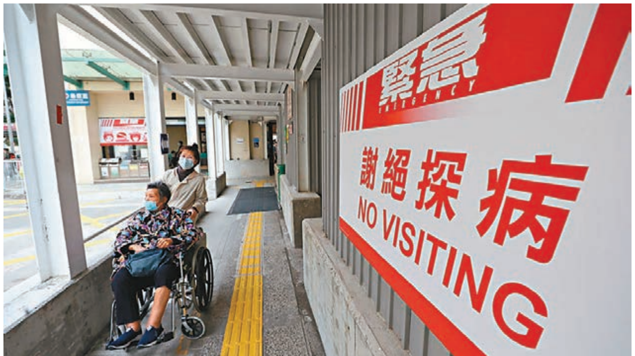
泛暴醫護罔顧市民求醫權利，悍然發動罷工。圖為市民到公院求醫。

員工參與罷工，即是無履行僱傭合約，將他即時解僱，雙方爭持不下，或要鬧上法庭，由法官釐定哪一方有理據。」他重申，工業行動並非無後果的，「工業行動是最後手段，最好的是勞資面對面商討，或尋找勞資主任作協調。」