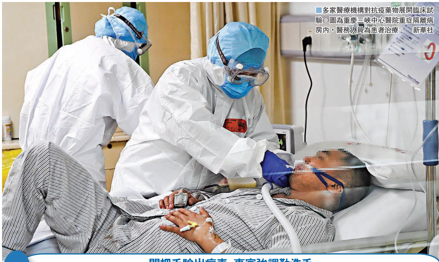
■多家醫療機構對抗疫藥物展開臨床試驗。圖為重慶三峽中心醫院重症隔離病房內，醫務人員為患者治療。

香港文匯報訊（記者 周琳 北京報道）針對目前一線臨床救治中藥物使用的進展情況，國家衛健委新聞發言人宋樹立3日在記者會上介紹說，目前有克力芝和中藥治療，臨床試驗正在收集臨床信息數據，最近還有一個藥物叫瑞德西韋，多家醫療機構正在就這個藥物組織開展臨床試驗，以及研究藥物的安全性和有效性。