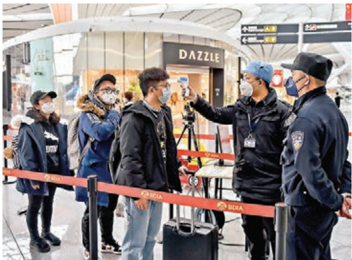
■疫情發生以來，中國政府一直採取了最全面、最嚴格的防控舉措。圖為旅客在北京大興國際機場航站樓接受體溫測量。新華社

「我們希望有關國家理性、冷靜、科學判斷和應對。中方願繼續本着公開透明和高度負責任態度，與世界衛生組織和國際社會加強合作。我們也有信心、有能力，盡快打贏這場戰役。」華春瑩說。