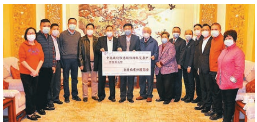
香港福建社團聯會向中聯辦賑災專戶捐贈300萬港元，協助內地對抗疫情。

她續說，罷工醫護其中一個不滿是裝備不足，希望醫管局提供足夠裝備。對繼續留守前線挺身對抗疫情、堅持專業操守、拒絕罷工的醫護人員及組織，她則致以最崇高的敬意。