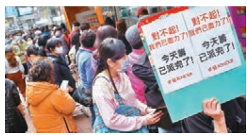
市面排隊搶口罩。

另一間化妝品店莎莎昨日在社交網站發帖，指33間分店將有日本口罩供應，但莎莎出post前已有大批市民排隊，分店營業時間前已派完籌，有不少客人到來時籌已派完要「摸門釘」。