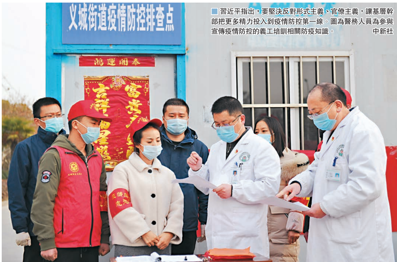
■ 習近平指出，要堅決反對形式主義、官僚主義，讓基層幹部把更多精力投入到疫情防控第一線。圖為醫務人員為參與宣傳疫情防控的義工培訓相關防疫知識。

香港文匯報訊 據新華社報道，中共中央政治局常委會昨日召開會議，聽取中央應對新型冠狀病毒肺炎疫情防控工作小組和有關部門關於疫情防控工作情況的匯報，研究下一步疫情防控工作。中共中央總書記習近平主持會議並發表重要講話。習近平指出，在疫情防控工作中，要堅決反對形式主義、官僚主義，讓基層幹部把更多精力投入到疫情防控第一線。