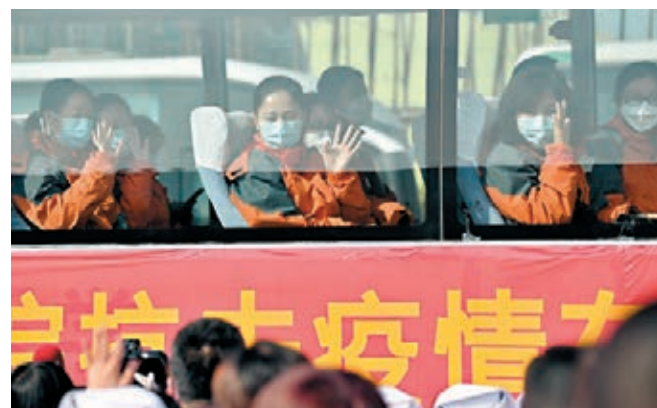
■ 西安醫務人員啟程馳援武漢。

會議強調，這次疫情是對我國治理體系和能力的一次大考，我們一定要總結經驗、吸取教訓。要針對這次疫情應對中暴露出來的短板和不足，健全國家應急管理體系，提高處理急難險重任務能力。要對公共衛生環境進行徹底排查整治，補齊公共衛生短板。要加強市場監管，堅決取締和嚴厲打擊非法野生動物市場和貿易，從源頭上控制重大公共衛生風險。要加強法治建設，強化公共衛生法治保障。要系統梳理國家儲備體系短板，提升儲備效能，優化關鍵物資生產能力佈局。