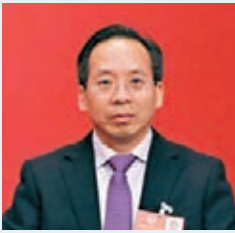
劉尚希稱，防止企業資金鏈斷裂，是首要解決問題。