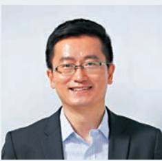
張明預計，央行降準降息時間會在下半年CPI增速回落後。