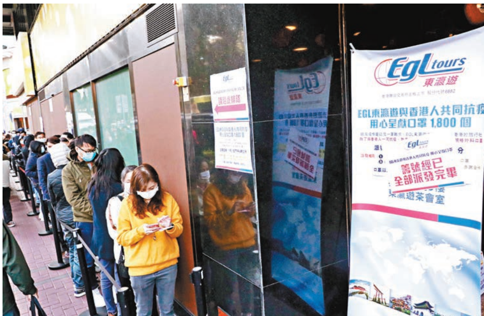
東瀛遊派免費口罩，派籌確認。

化妝品店卓悅於facebook公佈昨日中午12時起，旗下17間分店發售5個裝的口罩，每人只限買兩包。不過，直至昨午約1時各分店的存貨即火速售罄。一家九口的周太表示