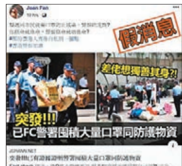
別有用心者胡亂指控警察囤積口罩。

警方批評別有用心者接連在網上發放失實流言，企圖煽動市民仇警情緒，意圖分化社會，是自私、幼稚、卑鄙的行為。面對疫情挑戰，香港警察定必謹守崗位，與社會各界同心同德，團結抗疫，全力擊退疫情。