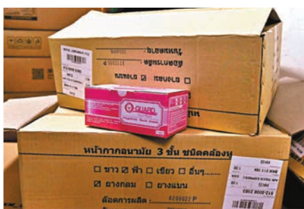
被盜口罩來自泰國。

另外，葵涌瑪嘉烈醫院發生懷疑職員「監守自盜」偷口罩案件。前日下午，瑪嘉烈醫院一間病房內醫護人員發現獲分派的防疫物資不尋常「大幅減少」，經點算及查核，發現約有14個外科口罩、22個N95口罩及一些外科手套未使