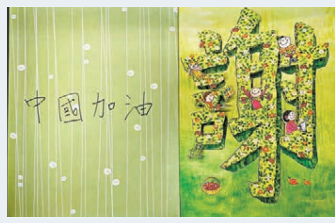
葵青警署全體警員寫心意卡，為全體抗疫醫護加油。