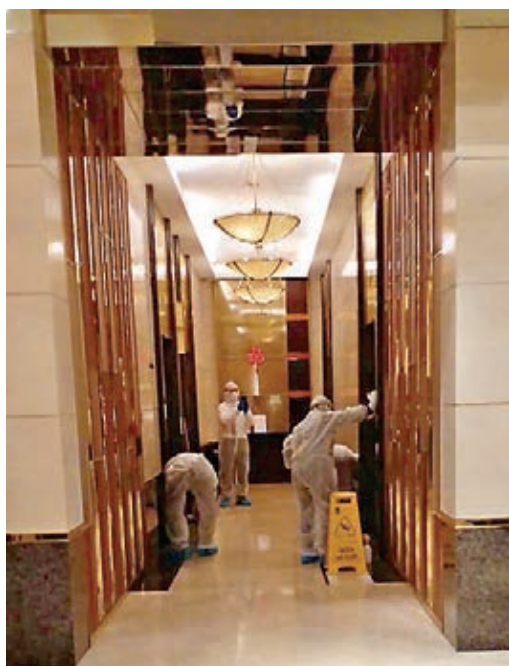
都會客棧客戶服務處已即時安排加強屋苑的清潔及消毒措施。

將軍澳醫院接受傳媒查詢時證實有關消息，並譴責有關患者不負責的行為，認為此舉不但影響病人自身健康，更有可能令傳染病散播到社區，對公共衛生構成風險，呼籲病人求診時，要配合醫護人員安排及遵從醫護人員指示。