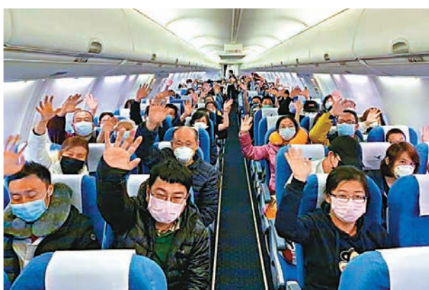
從馬來西亞返回的湖北旅客對於可以順利回國感到雀躍。