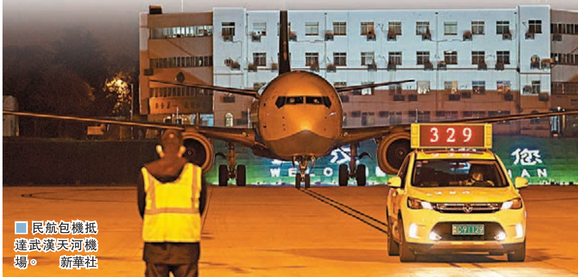
民航包機抵達武漢天河機場。