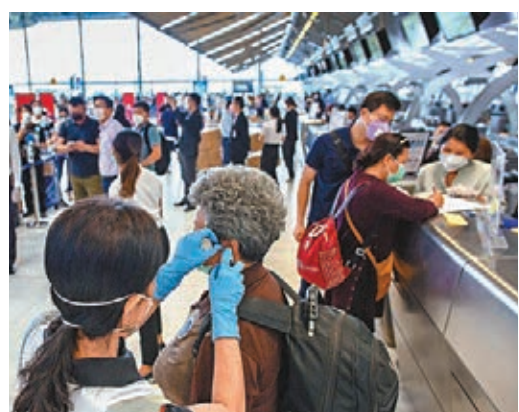
湖北旅客在曼谷登機前需接受多次探熱。