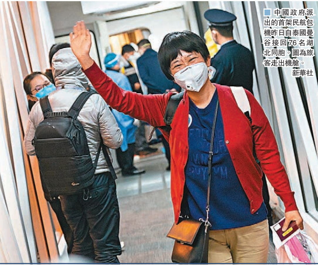
中國政府派出的首架民航包機昨日自泰國曼谷接回76名湖北同胞。圖為旅客走出機艙。新華社

香港文匯報訊(綜合人民網、央視網、香港文匯報記者葛沖及李理報道)歡迎回家!歡迎回家!昨日,大年初七,晚間9時18分,湖北武漢天河國際機場抵達大廳,溫暖的歡迎聲此起彼伏。「很想家,很想回來。」完成消毒步出機艙的旅客按捺不住心中的激動。這是一班由廈門航空執行的特殊包機,載着從曼谷回國的76名湖北旅客順利平安抵達家鄉。當天,中國政府宣佈安排包機,分別從泰國曼谷和馬來西亞哥打峇魯(亞庇)接回199名滯留在外的湖北旅客。