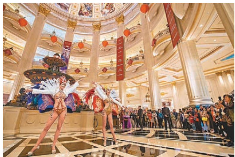
金沙中國指，訪澳人數大跌將影響業務，旗下賭場收入料面臨挑戰。