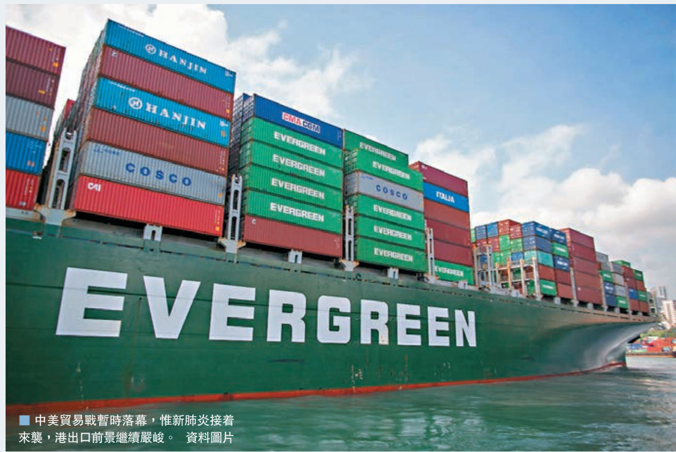
中美貿易戰暫時落幕，惟新肺炎接着來襲，港出口前景繼續嚴峻。資料圖片