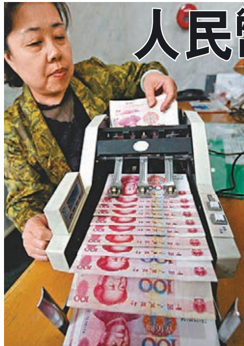
受新型肺炎消息拖累，人民幣重回跌軌。資料圖片

香港文匯報訊(記者 岑健榮) 新型冠狀病毒肺炎疫情不斷擴大，而截至昨日內地累計確診人數已增至逾7,700宗，確診宗數較2003年沙士疫情更多。市場憂慮內地經濟表現受疫情拖累，令人民幣匯價表現疲弱，昨日一度失守7兌一美元大關，為今年內首次。