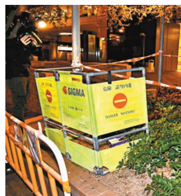
▲發現蝙蝠屍體花槽一度圍封。