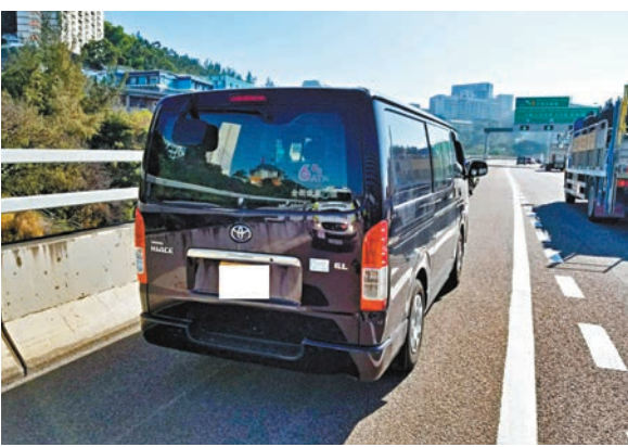
■警方利用「自動車牌識別系統」進行偵測行動截查可疑車輛。

警方會繼續於假期時採取執法行動以打擊相關違例罪行，以保障市民安全，各駕駛人士切勿以身試法。