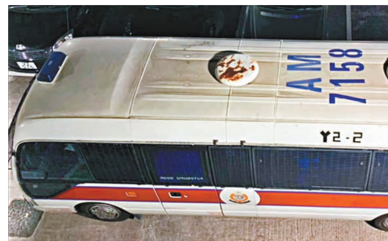
■一輛警車在旺角巡邏期間亦遭黑衣魔投擲汽油彈。

警方再次警告任何人切勿以身試法，特別是年輕人，千萬要小心，避免被人利用及煽動而斷送大好前程。