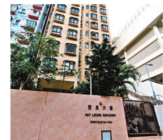
■鴨洲洲百良大廈揭發懷疑燒炭謀殺案。

警方其後再翻看大廈的閉路電視，並檢走一個盛炭的鐵鑊及一批藥物作化驗。案件目前交由西區警區重案組接手跟進，稍後將安排為死者進行驗屍，以確定其死因。