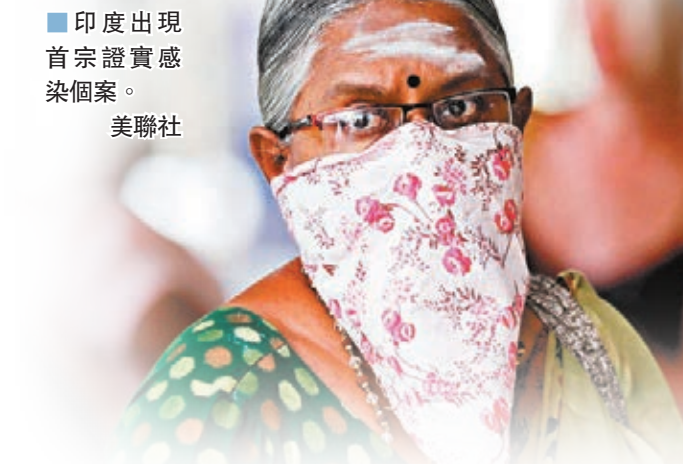
印度出現首宗證實感染個案。