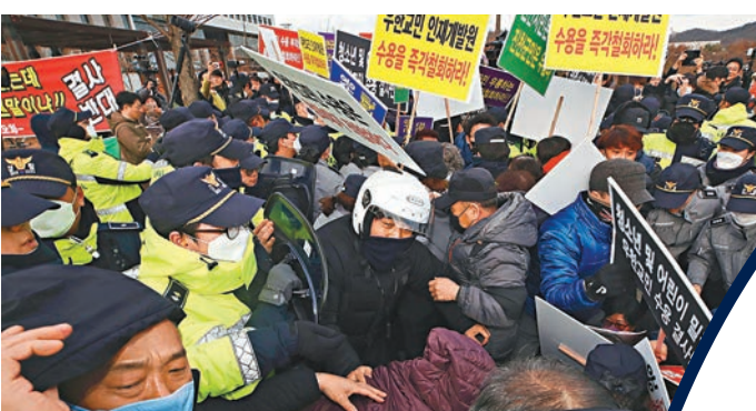
韓國居民不滿政府在他們住處附近隔離武漢僑民，與警員爆發衝突。

全球多國近日因應新型冠狀病毒疫情，分別派出包機到武漢，接載僑民回國，但日本外務省要求日本公民為包機支付8萬日圓(約5,709港元)費用，比鄰近的韓國高逾一倍，有身在武漢的日本人坦言費用過高，希望取消預訂，多名國會議員亦促請政府承擔包機費用。