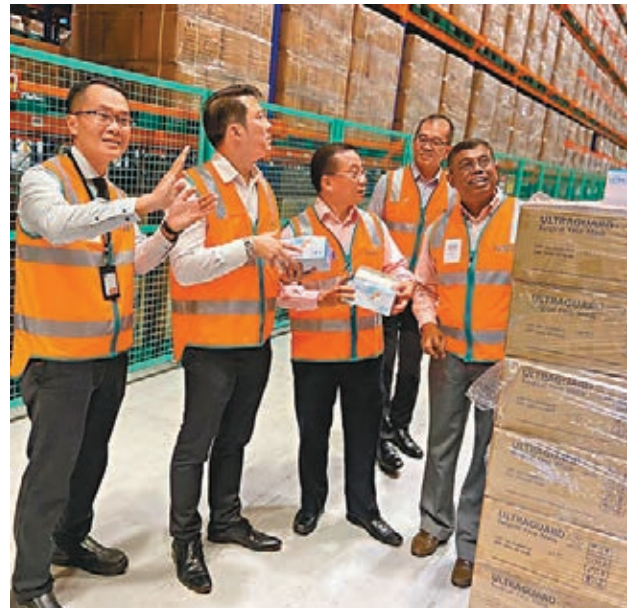
新加坡衛生部官員檢查貯存口罩的倉庫。