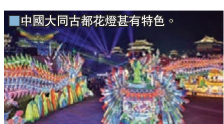
■中國大同古都花燈甚有特色。