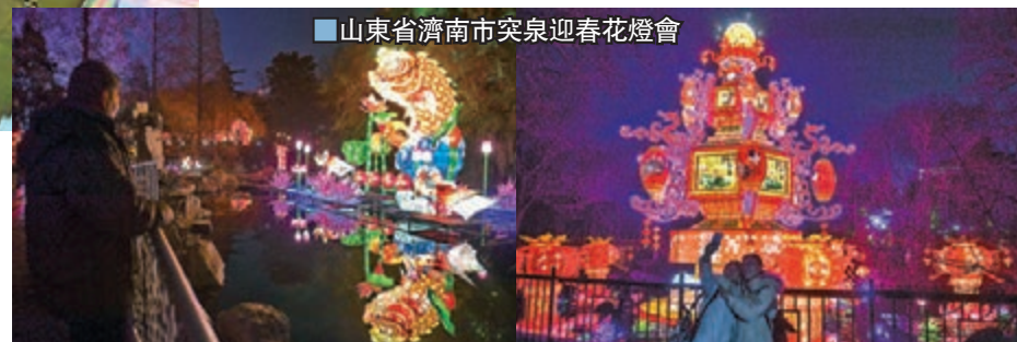
■山東省濟南市突泉迎春花燈會

河南山北坡的諸冰川支流，西北向流經隴北黨城灣，經黨河水庫，拐向東北，入敦煌綠洲，至敦煌市，原在北土窯墩注入疏勒河，並最終消耗於敦煌西湖。廣西南寧市青秀山的新春大型燈展燈組也很奪目，青秀山又名秦青嶺，因林木青翠，山勢秀拔而得名，素以「山不高而秀，水不深而清」著稱。現青秀山一般指青秀山風景區，位於廣西壯族自治區首府南寧市青秀區境內的邕江江畔，包括青山嶺、鳳凰嶺、鳳凰嶺、子嶺、佛子嶺、雷劈嶺等18座大小山嶺，是旅遊區。白天遊山玩水，晚上看花燈，節目挺豐富。其他城市例如山東山西大同、杭州、澳門的綵燈規模可能沒那麼大，但各有吸引之處。