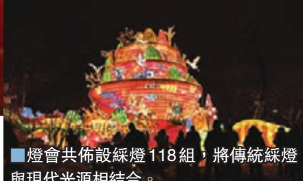
■燈會共佈設綵燈118組，將傳統綵燈與現代光源相結合。