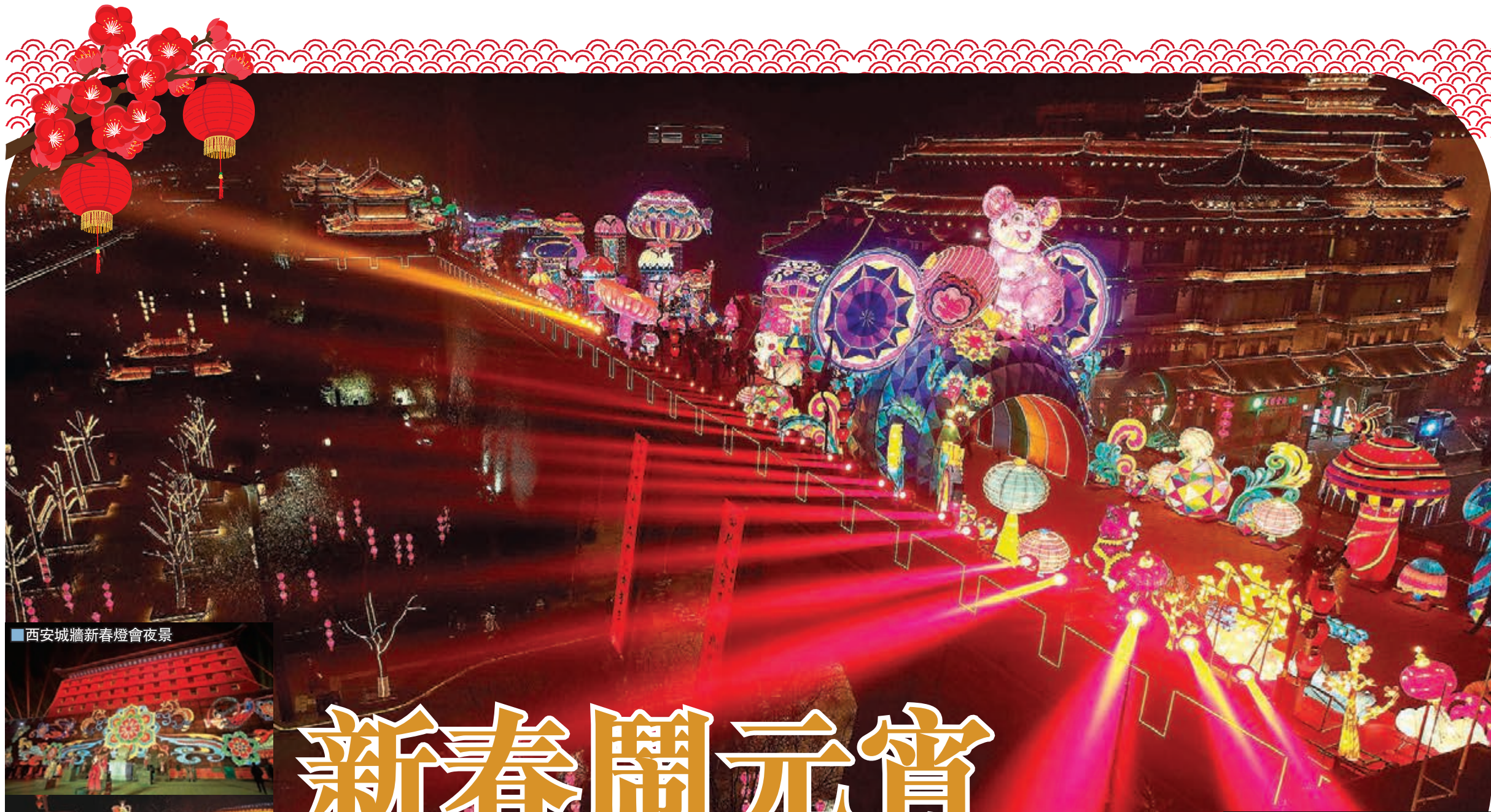
■西安城牆新春燈會夜景