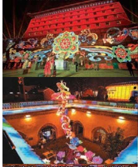
■河南陝州地坑院設置綵燈，非常特別。