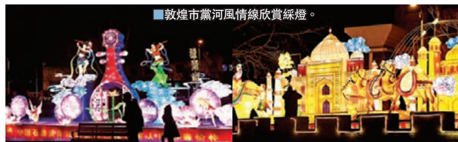
■敦煌市黨河風情線欣賞綵燈。