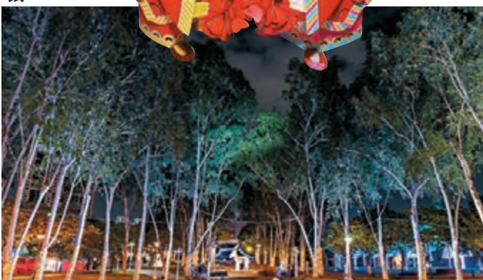
■台中燈會現場環境。