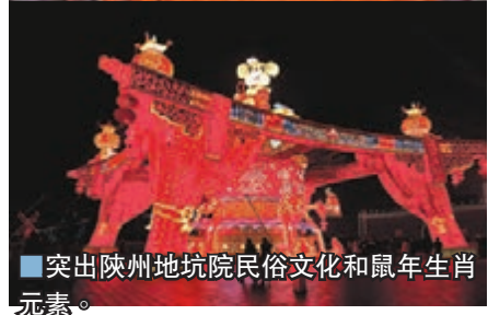
■突出陝州地坑院民俗文化和鼠年生肖元素。