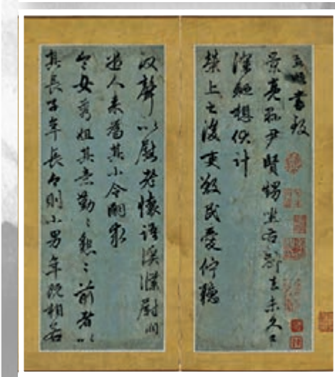
■趙孟頫作品《行書致張景亮信札冊》。