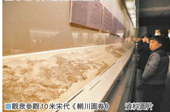
■觀眾參觀10米宋代《輞川圖卷》