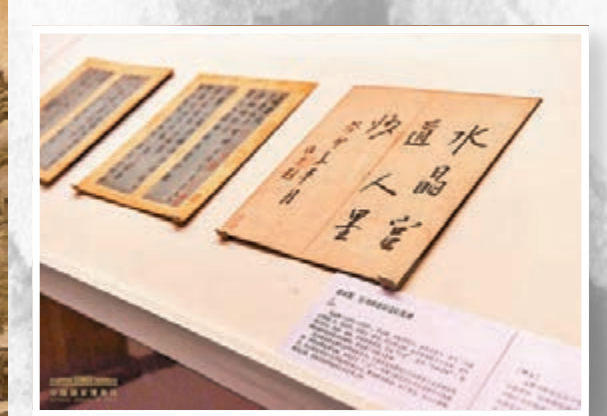
■趙孟頫《行書致張景亮信札冊》。