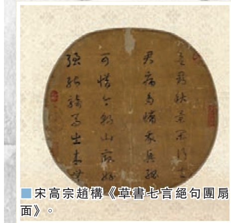
■宋高宗趙構《草書七言絕句團扇面》。