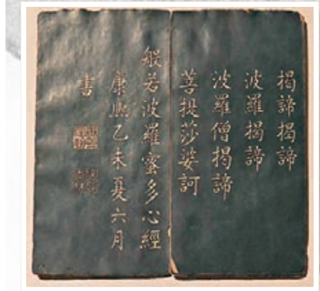
■玄燁 楷書《般若波羅蜜多心經》冊。