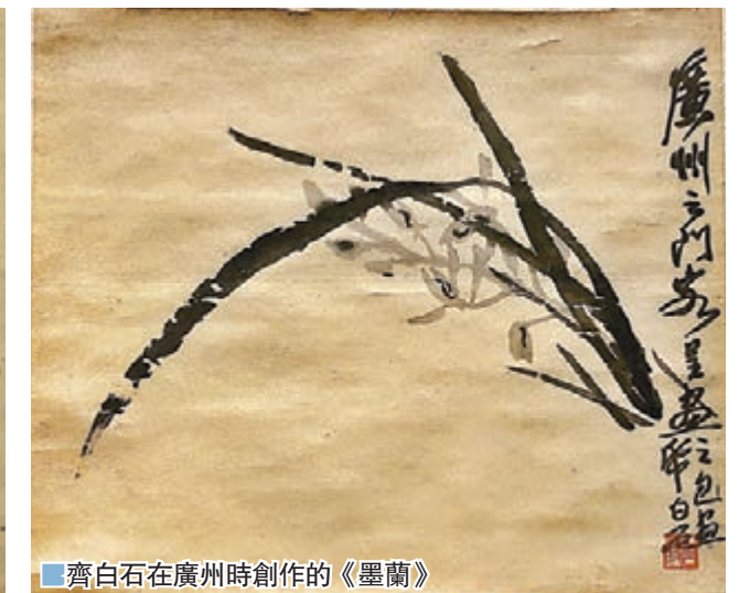
■齊白石在廣州時創作的《墨蘭》

左手因啜泣而拭淚，正是孩童既委屈又撒嬌的模樣。哪怕是整個畫面沒有一點背景，依然讓很多人回想起自己童年時不願上學的情景，令人忍俊不禁。