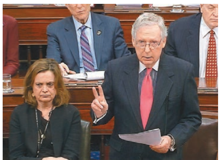
麥康奈爾據報認為，共和黨未必夠票阻止傳召證人。

民主黨若要傳召證人作證，需要最少4名共和黨參議員倒戈，加上全體47名民主黨及獨立參議員支持，方能通過。4名被視為最有可能倒戈的共和黨議員中，兩人日前已經表明會支持傳召證人，另外兩人則表示對此持開放態度。