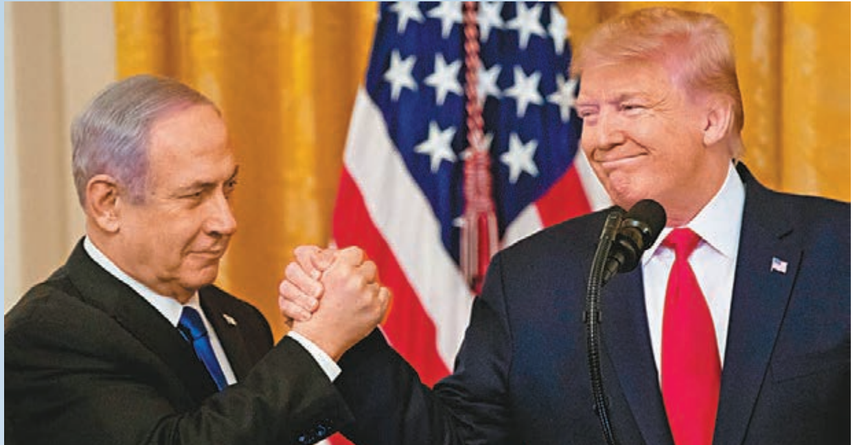
特朗普日前在白宮會晤內塔尼亞胡。

美國總統特朗普日前公佈所謂中東問題「世紀協議」後，立即上載方案所建議的巴勒斯坦國領土示意圖，當中除了將西岸的以色列猶太殖民區標示為「飛地」(Enclave)，更將西岸的巴勒斯坦土地分割得肢離破碎，只能透過隧道或橋樑連接，包括建議以一條「西岸隧道」連接西岸與加沙地帶。方案亦要求巴勒斯坦讓出西岸與約旦河之間的約旦河谷，變相將巴人領土完全與約旦分隔，令巴勒斯坦國變成以色列的「國中國」。