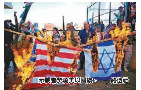
示威者焚燒美以國旗。