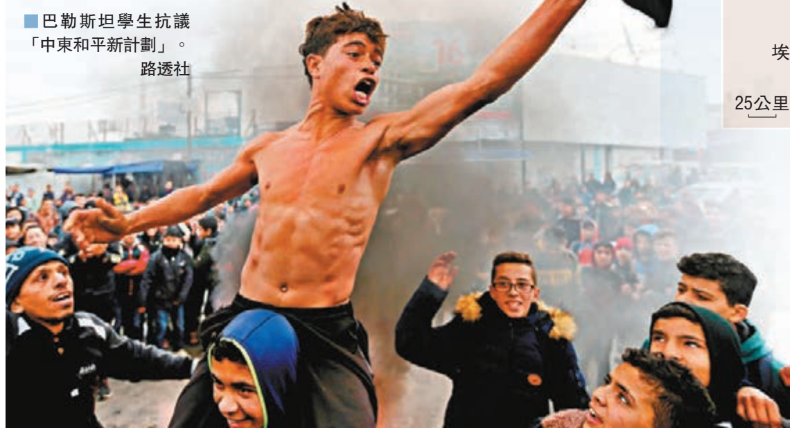
巴勒斯坦學生抗議「中東和平新計劃」。