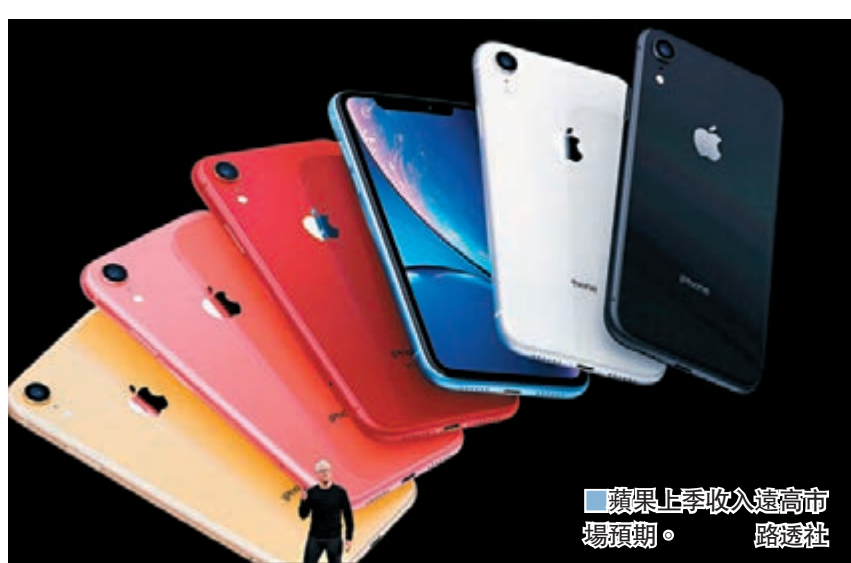
蘋果上季收入遠高市場預期。

去年初，蘋果曾以中國經濟降溫、iPhone銷情不佳為由罕見下調財務預測，股價曾單日暴跌10%，低見142美