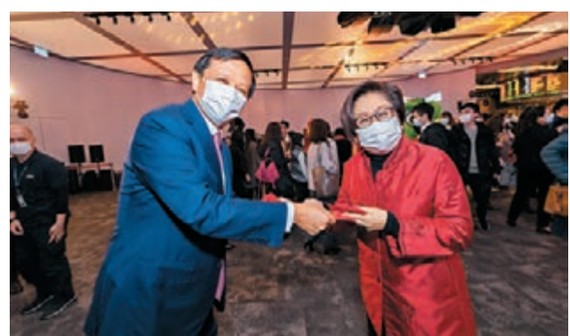
史美倫(右)及李小加(左)均戴上口罩向員工派發利是。

昨日為港股鼠年首個交易日，因應武漢新型冠狀病毒肺炎疫情，港交所(0388)取消原訂鼠年首個開市儀式的公開採訪安排，改為閉門進行。港交所主席史美倫，與港交所行政總裁李小加，仍然親自主持開市敲鑼儀式，並與港交所員工一同迎接鼠年新春首個交易日正式開市。銅鑼一敲，為鼠年首個交易日鳴響序幕。此外，港交所依舊安排醒獅表演助興，而史美倫和李小加也戴着口罩，向參加開市儀式的員工派發利是。