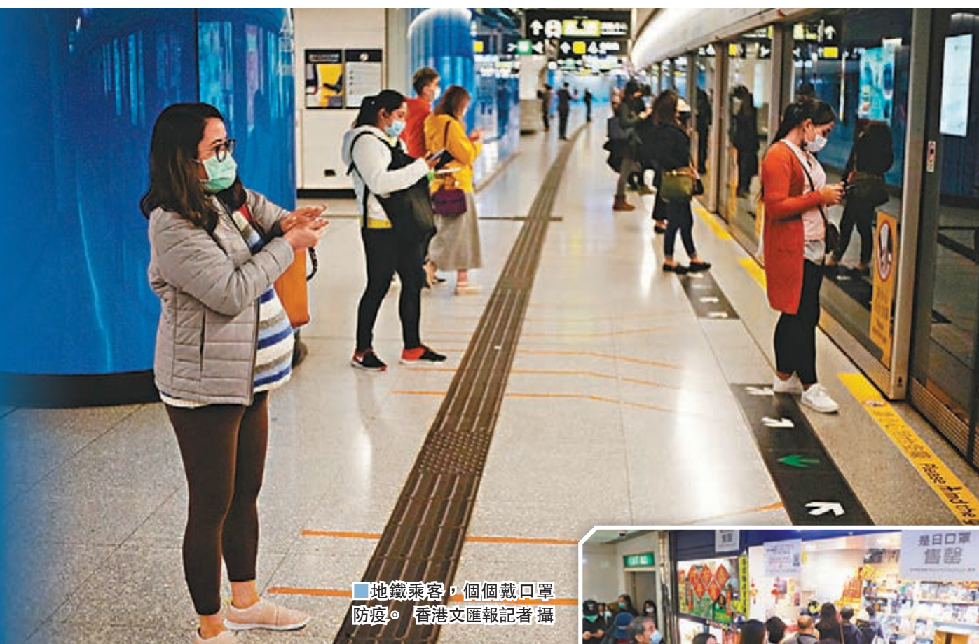
地鐵乘客，個個戴口罩防疫。

香港市民出現一片搶口罩潮，一間專賣泰國貨的雜貨店，昨日中午起於各分店出售口罩，每人限購一盒，並表明醫管局的前線人員，及邊境管理站的紀律部隊人員出示工作證或委任證，可優先購買。