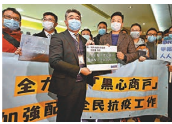
民建聯要求消委會設立「黑心商戶」名單。

民建聯又要求政府盡快全球採購口罩及其他防疫物品，並統一分配到指定零售商，以消委會或有關方面