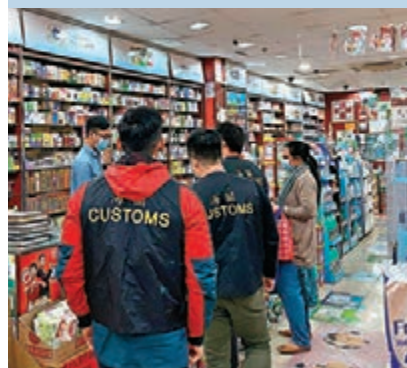
海關出動近200名海關人員進行全港性大規模外科口罩巡查行動。

香港文匯報訊（記者 文森）消委會上月中至今，共接獲11宗涉及商戶出售口罩的投訴，當中超過一半涉及貨品質素、價格爭議、營商手法等投訴。海關本週一起展開代號「守護者」的全港性大規模特別行動，出動近200名海關人員全面巡查各區及檢視市面上出售的外科口罩，截至昨日已巡查逾180個零售點，行動將持續進行。